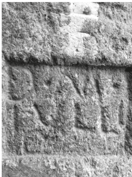
Fig. 4 – Pormenor da epígrafe da Fig. 3.

Não deixa de ser sedutora a hipótese de Fernando Coimbra de estarmos perante o epitáfio de uma criança; mas nada se poderá adiantar a esse respeito, inclusive porque, de um modo geral, quando há epitáfios de crianças, os pais não escondem a sua tristeza mediante a especificação, por exemplo, da tenra idade em que o filho faleceu. Dado, na verdade, o singular diminuto tamanho da epígrafe, não será essa uma hipótese descabida, mormente se atentarmos no facto de o nome vir em dativo, como que a simbolizar a homenagem que desta maneira se faz, e a sublinhar que mais ninguém será sepultado ali.