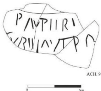
Fig. 6 – Desenho do fragmento com parte de um grafito. De ERA — Arqueologia.

Gravadas com goiva, após a cozedura, as duas linhas que restam do grafito apresentam-se muito bem delineadas, sendo possível até apercebermo-nos da pré-existência de ténues linhas auxiliares. O P — aberto — é de fino recorte; A também aberto, de hastes que não chegam a tocar-se no vértice; V de módulo mais pequeno; E grafado com dois II, opção normal em grafitos; R feito a partir do P , elegante. Na l. 2, creio possível ver a parte superior de um S e, depois, IR em nexos; de novo, E grafado com dois II; o S muito oblongo; a barra do T pode ter coincido com a linha auxiliar.