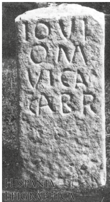
Fig. 1 – Ara de uns vicani a Júpiter.

Também Jorge Alarcão foi informado verbalmente da descoberta desta epígrafe. A ela se refere, por conseguinte, em 2/96 (p. 44 do fascículo 1 do volume II do seu Roman Portugal ). Explicita que a ara surgiu por ocasião da «realização de obras no interior da igreja matriz», dá como leitura IOVI/O M/VICA/LABR e acrescenta: «Aparentemente, temos aqui testemunho de um “vicus” que oficialmente consagrou uma ara a “Iuppiter Optimus Maximus”». Anote-se que a informação relativa às obras no templo sugeriu que a pedra estivesse incorporada nalguma das paredes, o que, como atrás se disse, não corresponde à realidade.