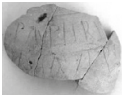
Fig. 6a – Fotografia do potinho com o grafito.

Concordo: é achado relevante, porque, na verdade, também se me afigura que a única leitura plausível da l. 1 é a da palavra pauperi . Se o S inicial da l. 2 constitui o final dessa palavra, teríamos, nesse caso, o plural: pauperibus ou, menos provavelmente, o genitivo pauperis . Aparentemente, não padece dúvida o significado do vocábulo: trata-se de pauper , «pobre», substantivo comum ou adjetivo. É raro, como se