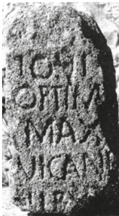
Fig. 2 – Ara de Torre de Moncorvo.