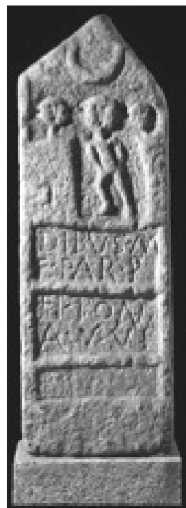
Fig. 8 – Estela com baixo-relevo.

Teve João Vaz particular carinho, diríamos, por este monumento, pois o escolheu para ilustrar a capa do Breve Catálogo das Inscrições Romanas de Lamego , separata autónoma do artigo que publicara, em 1982, na revista Beira Alta e que pôde servir, desta sorte, como catálogo da exposição temporária patente no Museu de Lamego, em Outubro–Dezembro de 1983.