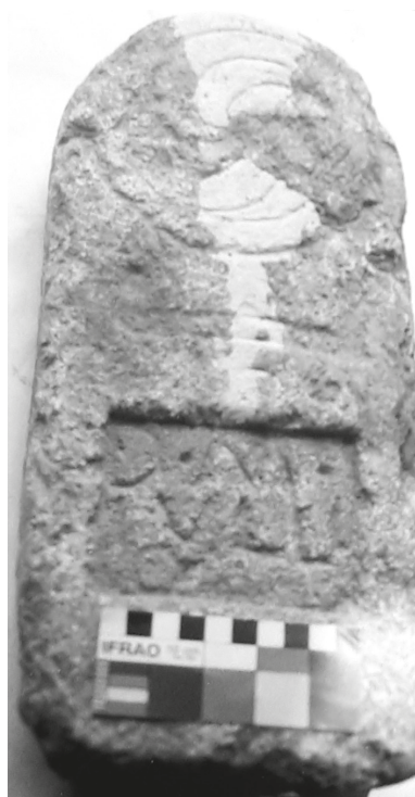
Fig. 3 – Pequena estela de Iullius .

Acrescenta, na nota 137, que, sendo «uma peça de dimensões muito mais pequenas que o habitual», esse facto, «juntamente com a inexistência de indicação da idade do defunto, estando a inscrição completa, leva-nos a colocar a hipótese de se tratar do epitáfio de um bebé».