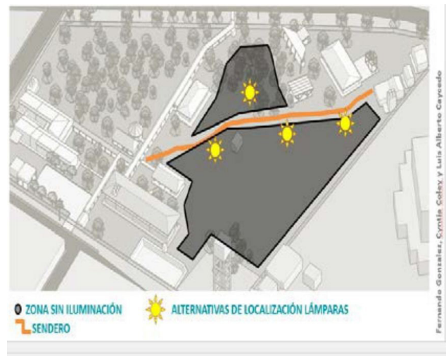
Figura 3. Sistema de recolección de aguas lluvias antes de la intervención del proyecto.

De acuerdo con varios estudios analizados en este trabajo, las edificaciones funcionan como almacenamientos de calor durante el día, mientras que la energía almacenada se libera en su espacio interior a lo largo de la noche; así se presenta un efecto negativo, puesto que la demanda de climatización artificial se aumenta y el potencial para la ventilación pasiva se reduce durante la noche. (Muñoz Campillo, y Torres Sena, 2013) Se pretende resolver la carencia de un sector del centro que no cuenta con iluminación ni cableado que permita alimentar lámparas convencionales. Por lo anterior los sistemas foto voltaicos que no requieren conexión a fuente de alimentación, posibilitan verificar y dar a conocer sus beneficios a la comunidad, que dadas las condiciones del Guainía que no está conectado al sistema nacional, es muy pertinente como alternativa de solución viable y rápida que posibilite acceder a los beneficios de la energía a comunidades alejadas.