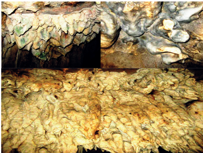
Figura 3: Rompimiento de los espeleotemas en la caverna Sabana de León y cueva Coco Loco.