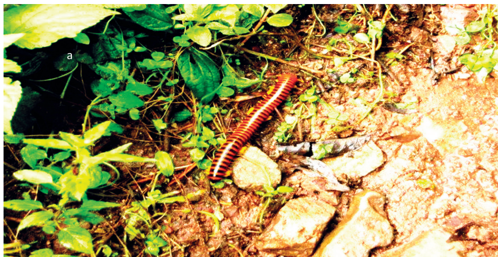
Figura 5: Clase Diplopoda, orden Polydesmida, suborden Chelodesmidea, familia Chelodesmidea y nombre común Milpíes.