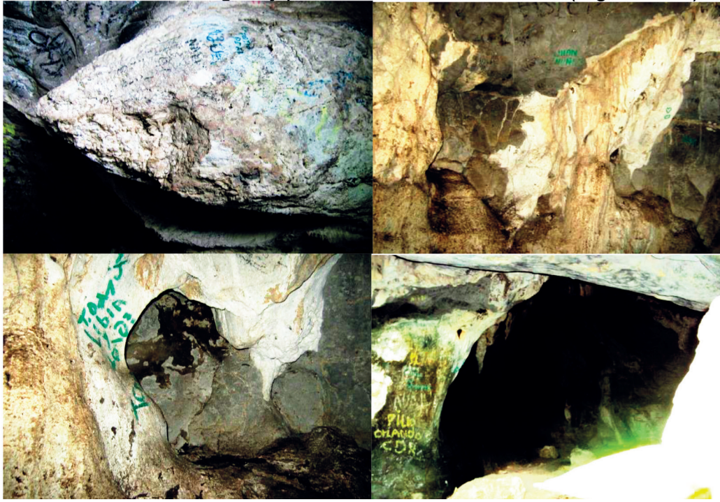
Figura 2: Grafiti en las paredes y techos de la caverna Sabana de León y Cueva Coco Loco.