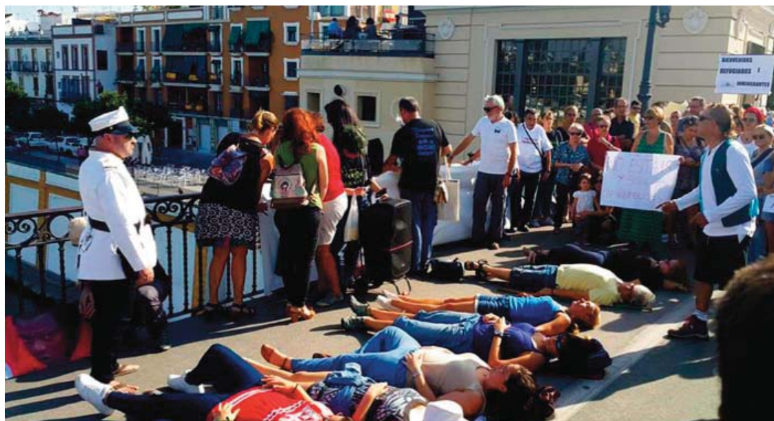
■ Almazara teatro en «tendiendo puentes a los refugiados» con la obra «La ciénaga».