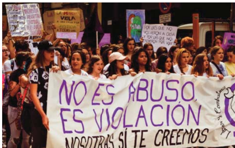
■ Manifestación a favor de la víctima de La Manada el 10 de mayo en Sevilla.