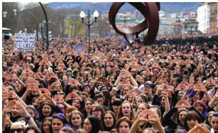
-Manifestación 8-M en Plaza Moyúa, Bilbao. /Tremending