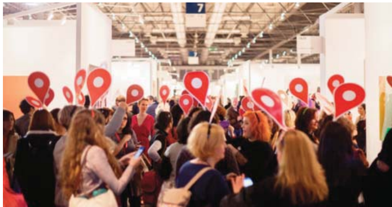
Acción «Estamos aquí» de Yolanda Domínguez en ARCO, 2017.