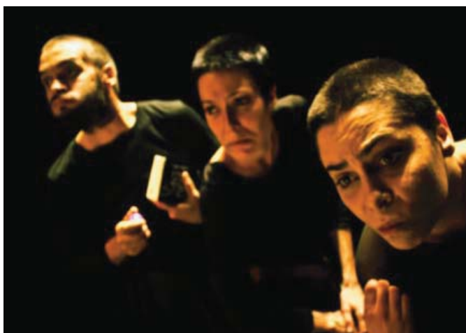
Actores de Trasto Teatro en «Los satisfechos».

Y es ahora el momento oportuno para actuar, para activar a la ciudadanía, para hacer partícipes a las personas de lo que ocurre en la actualidad. En una realidad sin maquillaje, sin circo y casi sin pan. En las dis-