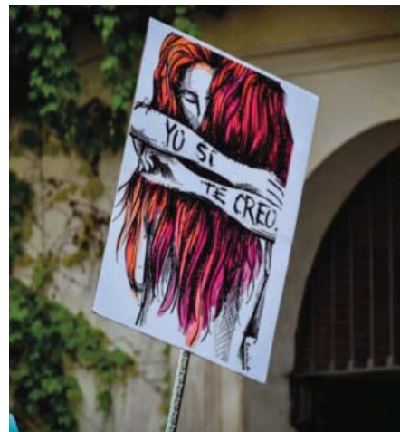
Cartel para Principia, autora: Emma Gasgó.