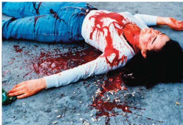
Performance «Sangre en la Calle» de Pilar Albarracín en 1992.