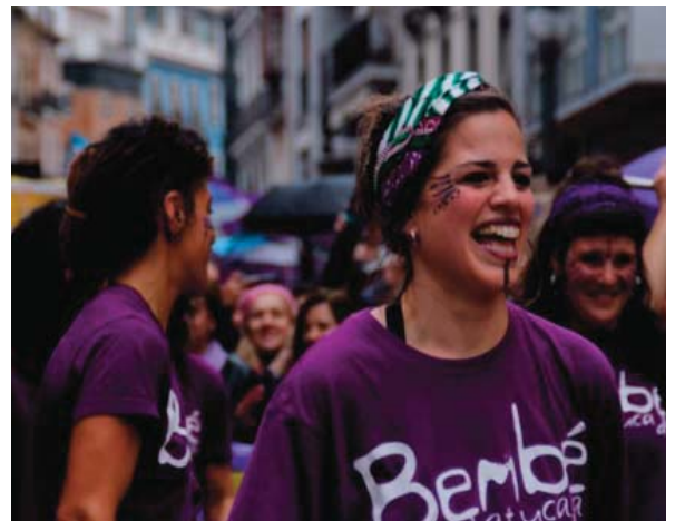
Participación de Bembé Batucada en la manifestación de Granada del 8-M.