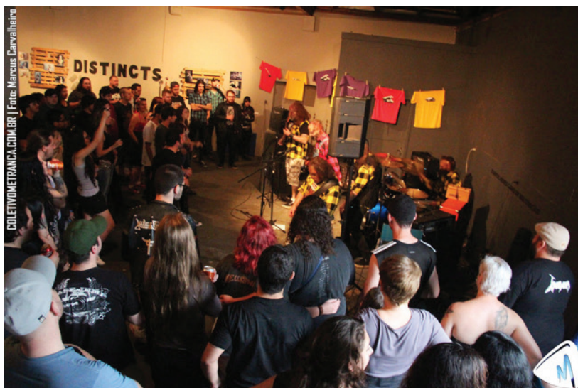
Figura 3 – Show da banda Zombie Cookbook no Ocupa Cidadela

por moshs 28 (rodas punk ) e wall of death 29 , não seja adaptada facilmente a qualquer espaço ou compreendida imediatamente por pessoas que não estão acostumadas com esse código. Como exemplo, proponho analisar as imagens dos shows da banda Zombie Cookbook na Cidadela Cultural Antártica (figura 3), durante o Ocupa Rock , e no Metal Joinville Festival , realizado no Garage Bar (figura 4):