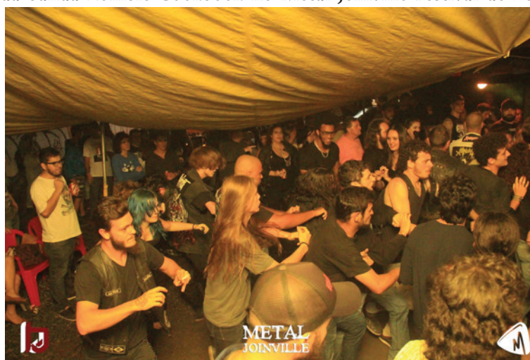
Figura 4 – Show da banda Zombie Cookbook no Metal Joinville Festival de 2016