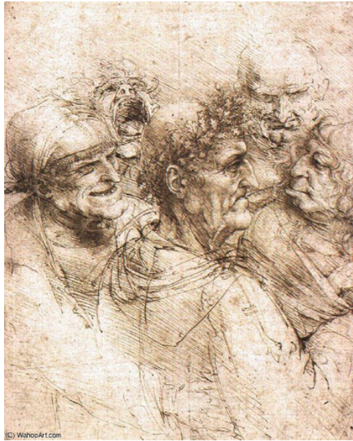
Figura 2 – Cabeças grotescas – Leonardo da Vinci, c. 1490 (26 x 20 cm) – Royal Library, Castelo de Windsor, Londres