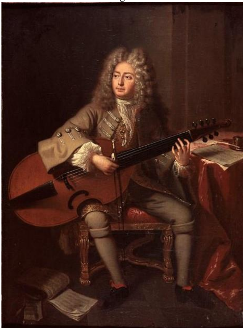
Portrait du musicien Marin Marais (1704), de André Bouys (1656-1740). Paris, bibliothèque-musée de l'Opéra Garnier.