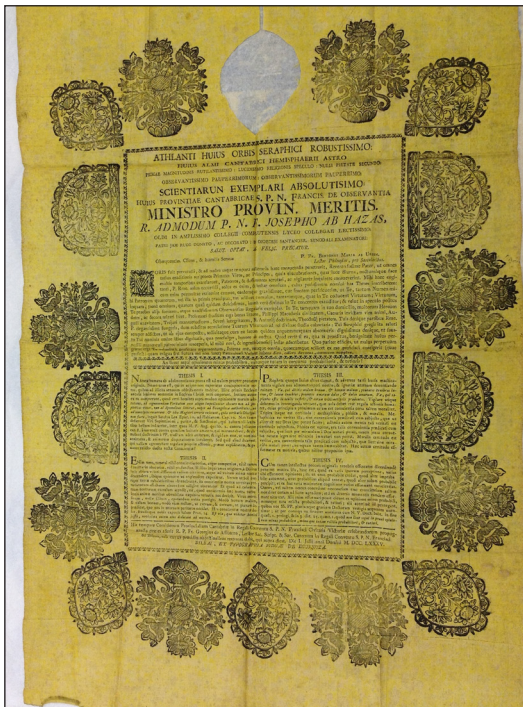
Fig. 6. Tesis de grado de Benigno María de Urien (F. Vives).

El desarrollo ornamental es muy similar a la hoja de Domingo de Monesterioguren, en cuanto que algunos de los motivos de la orla se repiten. 14 El texto se encuentra enmarcado primeramente por una pequeña cenefa para después quedar todo ello remarcado por una serie de motivos que son el resultado de la aplicación de tacos de madera sin un elemento unificador. De estos tacos, se presentan tres modelos: en primer lugar, en las cuatro esquinas y en el centro de los lados menores, un elemento de forma romboidal festoneado con motivos vegetales que encierra en su interior un jarrón con dos asas que acoge tres grandes ramas con una flor abierta en cada una de ellas. 15 En segundo lugar y en cada uno de los lados mayores, dos arcos festoneados del mismo modo y encerrando en su interior el mismo jarrón con dos asas de cuyo interior salen cinco ramas con grandes flores abiertas. Por último, y en tercer lugar, flanqueando los elementos romboidales en los lados menores y alternándose con los arcos en los lados mayores, unos jarrones de dos