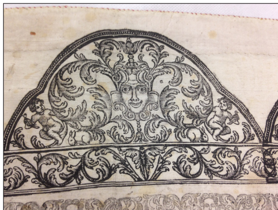
Fig.2. Detalle de la orla de la Tesis de grado de J. González del Cotero (F. Vives).

La belleza y el valor de esta tesis de grado radica, además de la información que proporciona, en el protagonismo de las labores artísticas que la ornamentan y que muestran un lenguaje propio del último barroco y su ejecución sobre una pieza de tafetán de seda en color crudo cuyas dimensiones son 104 cm. x 80 cm.