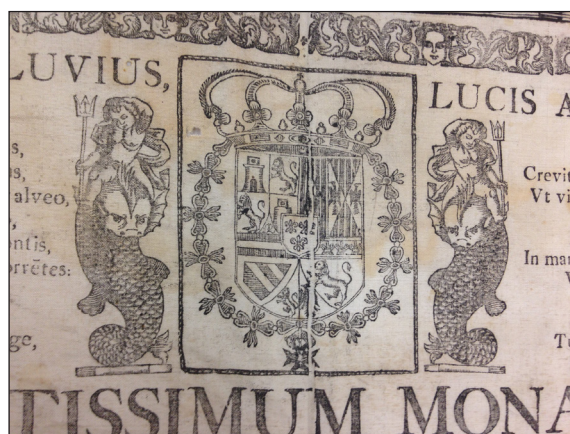
Fig.3. Detalle del encabezamiento de la Tesis de grado de Joaquín González del Coterro (F. Vives).

Casi todo el tercio superior del espacio dedicado al texto lo ocupa la dedicatoria que el graduando hace al rey Felipe V de España: «A Nuestro Invictísimo Monarca Don Felipe V cuya vida dure largamente, cuya victoria se extienda por el mundo, en su Real y Supremo Senado de las Indias, donde se ve llevado como un carro a la gloria, una corriente vuelta al sol». 9 Al texto de la dedicatoria acompaña el escudo real en el centro, enmarcado por un sencillo cordón y flanqueado a cada lado por la imagen de un delfín sobre el que se sitúa un niño desnudo que sostiene un tridente en una mano [Fig. 3]. Figuras que se repiten en los extremos.