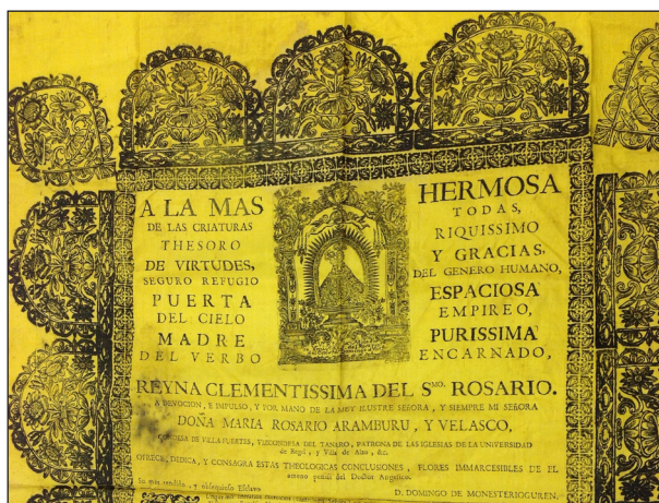
Fig. 5. Detalle de la imagen de la Virgen de la tesis de grado de Domingo de Monesterioguren (F. Vives).

Además de la orla decorativa, la hoja de grado presenta la letra inicial del texto, la A mayúscula, ornada con motivos vegetales. Pero el grabado más destacable es el de la imagen de la Virgen del Rosario que preside el texto. [Fig. 5] Un grabado, como se indica en su parte inferior realizado por Cueto. La pieza presenta la imagen de la Virgen dentro de una hornacina absolutamente ornamentada, en gran medida por motivos vegetales, y en cuyos extremos superiores destacan los anagramas de la orden dominica y de la Virgen María, rematándose el arco con la cabeza de un querubín alado. Sobre la imagen de la Virgen, dos angelillos la coronan. En el interior de la hornacina, en su parte inferior, dos jarrones flanquean la imagen, mientras que en la parte superior lo hacen dos candelabros encendidos de tres brazos. Por último, bajo la imagen de la Virgen, la inscripción «Vº Rº de la Milagrosa Ymagn. d N.S. del Rosario del Convº d S Domingo de Victª».