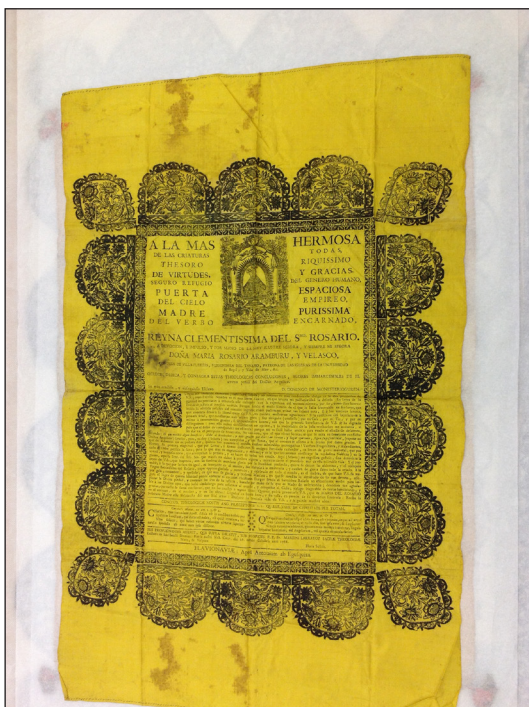
Fig. 4 Tesis de grado de Domingo de Monesterioguren (F. Vives).

Este segundo ejemplar conservado en Vitoria, a pesar de cumplir las características generales expuestas anteriormente, muestra algunas diferencias en cuanto al formato y al contenido. Respecto al grado académico a obtener, en ningún apartado del mismo se concreta, solamente en la parte final, la relativa a las conclusiones, se hace referencia a que son teológicas. 12 Por otro lado, la única información que se puede sustraer del documento con respecto al autor, Domingo de Monesterioguren, es que fue un fraile dominico del convento de Santo Domingo de Vitoria, pues es allí donde se anuncia la defensa para el 26 de octubre de 1768 13 bajo el magisterio del también fraile dominico Martín Larrayoz, lector de Sagrada Escritura del dicho convento vitoriano, y porque además la primera parte de la dedicatoria, que ocupa el tercio superior del documento, se hace a la imagen de la