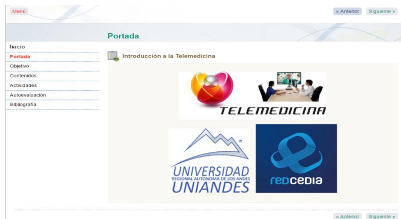
Figura 3. Presentación del O. A. desarrollado