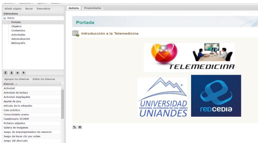
Figura 2. Desarrollo del O. A. en exelearning

Luego de realizado el diseño se procedió al desarrollo del objeto de aprendizaje en el programa exelearning. A continuación algunas capturas de ese desarrollo.