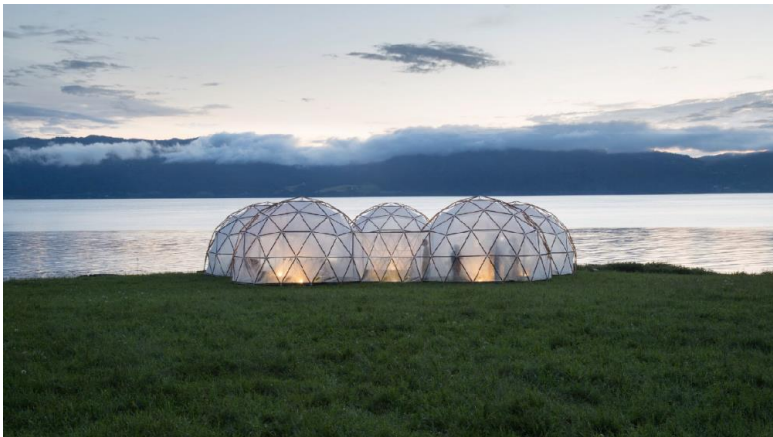
Fig. 3 Hyperobjekt Pollution Pods (Pinsky, 2018)

donde podíamos reconocer lo que se mantenía estable y lo que no, hoy vivimos una transformación global que nos transforma en desorientados. Para Ulrich Beck, la metamorfosis del mundo es el intento de comprender la globalización del cambio y de resumir los desafíos actuales como el calentamiento global y la migración en un concepto o en una imagen que capta la calidad de este desafío. El mundo ya no se encuentra en una especie de cambio. Por lo tanto, los cambios ya no se pueden describir con el vocabulario que se usaba hasta ahora, sino en una metamorfosis, un cambio de configuración (Beck 2016).