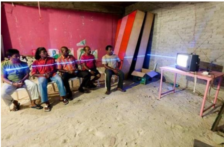
Fig. 4 Hyperobject Meeresspiegelanstieg (Jehnichen, 2012)

Bruno Latour ha descrito el suceso de manera ficticia, de modo que los términos territorio y metamorfosis se hicieron efectivos y había que tratar la dicotomía de “el territorio es demasiado estrecho y limitado para el globo de la globalización” (Latour 2018, S. 25) y “el territorio es demasiado grande, activo, complejo para encerrarlo en los estrechos límites de alguna localidad”.