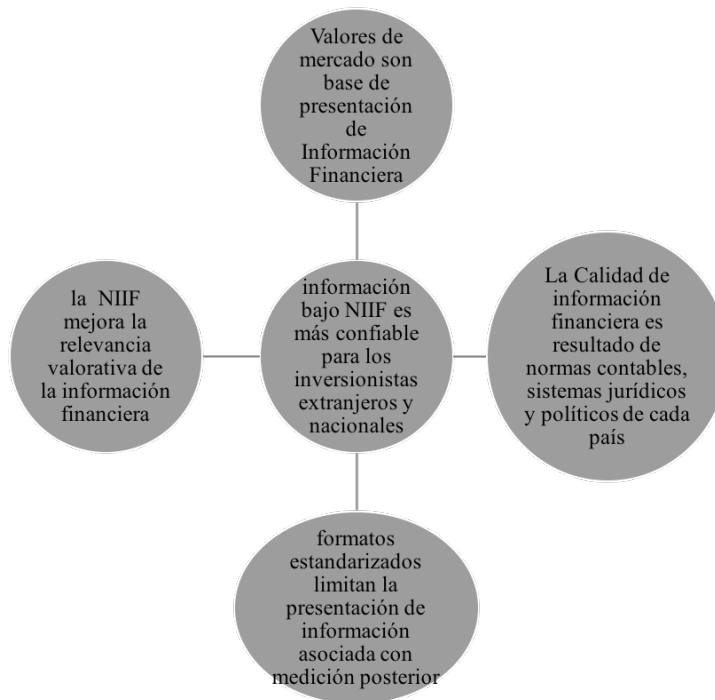
Gráfico 1. Elementos de interés según marco de antecedentes