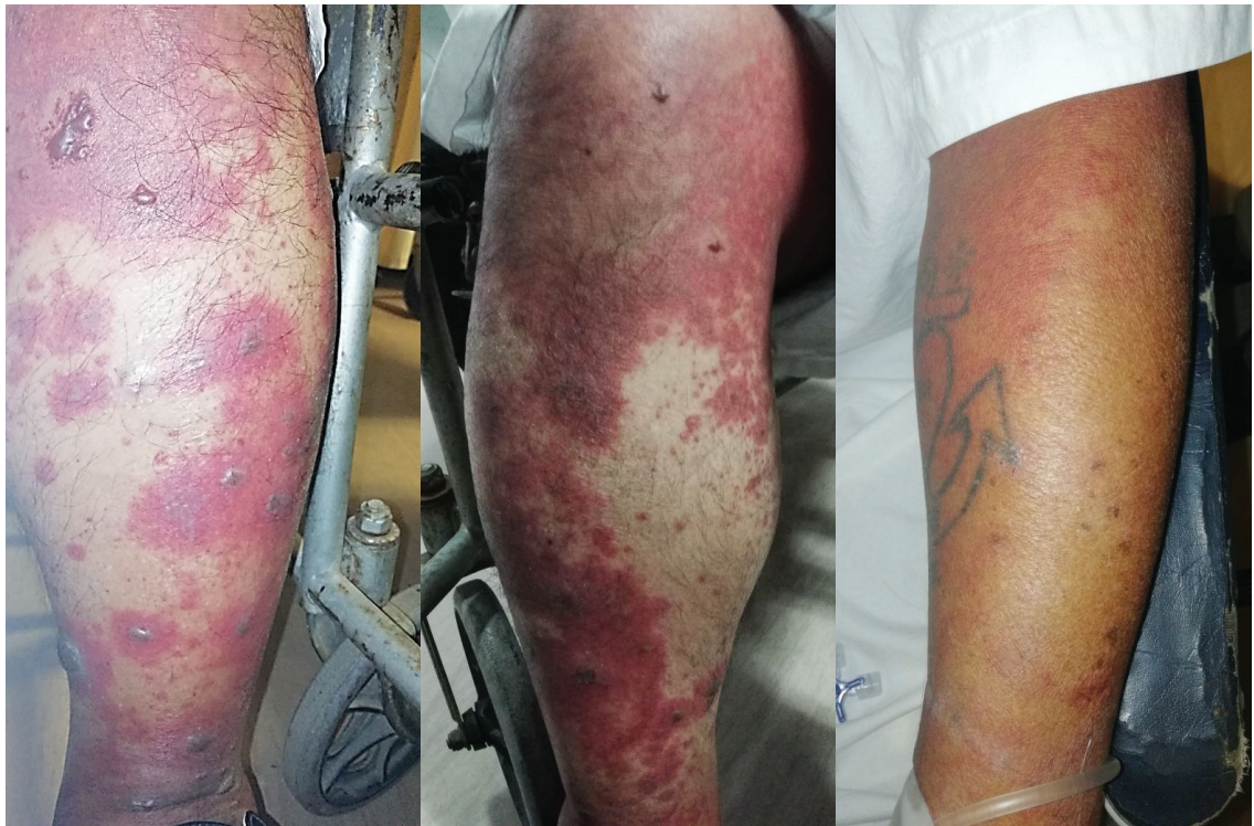
Figura 1: Lesiones eritematosas y violáceas con algunas flictenas en miembros inferiores y miembro superior

Paciente varón de 69 años de edad quien sufrió mordedura de serpiente en mano izquierda; se le administra suero antiofídico polivalente (dosfrascos) siendo dado de alta sin complicaciones, dos días después. Dos semanas después inicia rinorrea y sensación de alza térmica no cuantificada, para lo cual se medica con metamizol oral; dos horas después, aparecen lesiones pruriginosas, eritematosas y de aspecto morbiliforme en miembros inferiores acompañado de flictenas que progresaron a extremidades superiores y zona abdominal inferior, motivo por el cual acude al hospital.