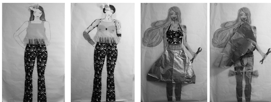
Figuras 6 y 7: Algunos trabajos finales del alumnado.

Para esta intervención proponemos al alumnado deconstruir los cánones que hayan quedado evidenciados en los diseños. Para ello, en primera instancia, identificamos cuáles son los estereotipos más marcados en cada creación y de qué manera podemos incidir sobre ellos plásticamente para llevar a cabo una deconstrucción.