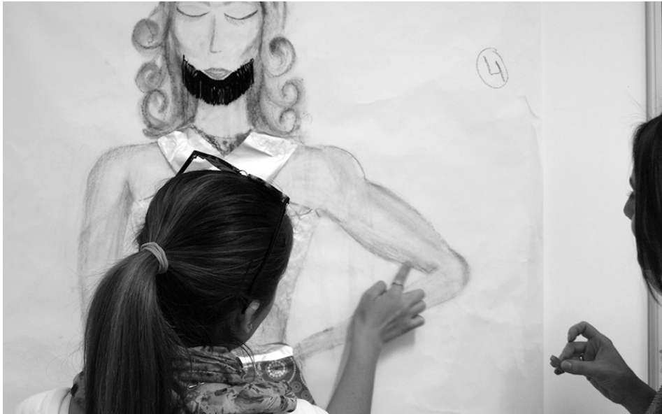
Figura 4: El propio alumnado interviniendo sus diseños tras el aporte teórico.

Una vez realizados los dibujos, ahora sí, exponemos los contenidos y objetivos anteriormente explicados al alumnado, el cual, como decíamos, desconocía nuestras pretensiones con el objeto de no persuadir sus creaciones. Tras la clase teórica, comentamos los resultados en común, tanto de los test como de sus dibujos, comparándolos con los que habían realizado hasta el momento. Obtenemos conclusiones muy valiosas, lo cual nos incentiva para llevar a cabo la última parte de la actividad: proponemos al alumnado intervenir sus mismas creaciones gráficamente desde una perspectiva inclusiva, atendiendo a la diversidad sexual y de género (Figuras 4 y 5).