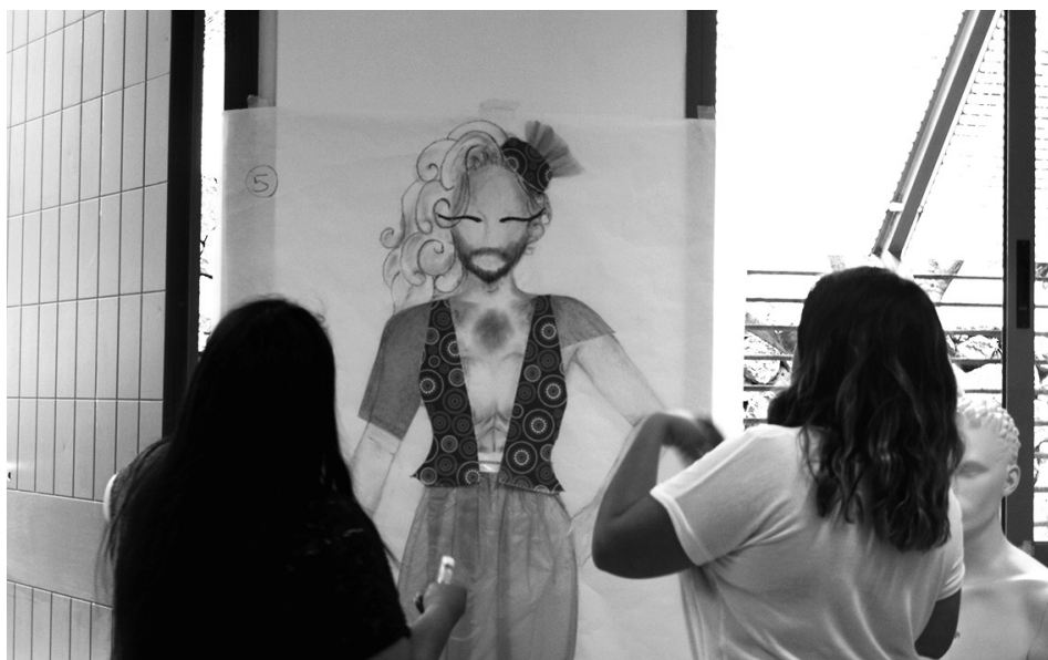
Figura 5: El propio alumnado interviniendo sus diseños tras el aporte teórico.

Para esta intervención proponemos al alumnado deconstruir los cánones que hayan quedado evidenciados en los diseños. Para ello, en primera instancia, identificamos cuáles son los estereotipos más marcados en cada creación y de qué manera podemos incidir sobre ellos plásticamente para llevar a cabo una deconstrucción.