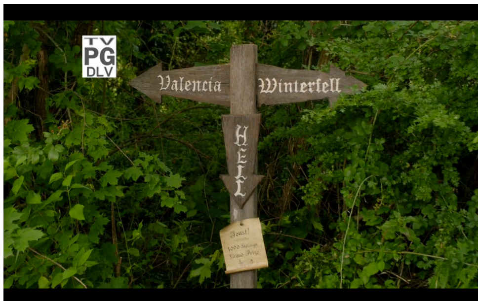
Ilustración 2: Referencia visual a la serie Juego de Tronos.

sentaba únicamente aspectos narrativos (aunque conscientes del estereotipo), planteando la historia, y la recapitulación de la segunda temporada ("Galavant Recap"), que inicia su letra afirmando que se trata de una historia ("La trama está ganando fuerza" 16 ) y finaliza reconociendo que se trata de una sitcom de media hora ("Tanto para volcar en su alfombra / en nuestra serie de media hora" 17 ). Este número musical de recapitulación, además de articular una acelerada secuencia de montaje con fragmentos de capítulos anteriores, comienza y finaliza con el Bufón, quien interpreta la canción a modo de narrador, en el medio del campo de la batalla final (el episodio se titula "La batalla de los tres ejércitos") que unifica todas las líneas narrativas de la temporada. Luego de unos instantes de tenso silencio, donde se muestran los ejércitos de cada bando alineados, todos comienzan a aplaudir al intérprete, que agradece mientras sale de escena. Madalena, ya convertida en Reina Malvada, afirma "tengo que admitir, el chico sabe cantar", como cierre de un número plenamente consciente del artificio de la representación.