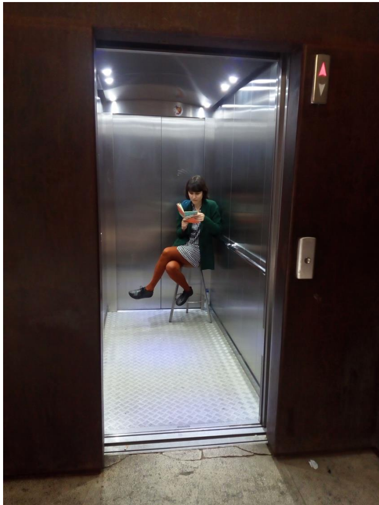
Imagen 2. Leyendo Caminar de H. D. Thoreau en el Ascensor.

PRIMERA CONEXIÓN: MOVIMIENTO. El ascensor donde realicé la acción está situado justo al lado de La Escalinata neo-mudéjar en Teruel. Por lo tanto, si decidimos salvar el desnivel existente entre los jardines de la estación de tren y la zona del Óvalo, en el centro de la ciudad, tenemos dos opciones. Una opción sería subir La Escalinata a pie y la otra consiste en utilizar el ascensor público. Realizar la lectura de Caminar dentro del ascensor supone activar un juego de opuestos entre la idea de movimiento horizontal (caminar) frente a la idea de movimiento vertical (elevarse automáticamente).