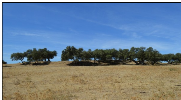
Fig. 4. La Alcaidía.

La Alcaidía: no da excesivos datos sobre este asentamiento, aunque en línea con lo mencionado en el anterior, cree que hubo un sitio ocupado en diferentes momentos. Los trabajos de campo realizados confirman que hubo un asentamiento. En este caso, los resultados nos invitan a pensar en un yacimiento monofásico, cuya extensión sería de aproximadamente 0,65 ha. Destaca que la gran mayoría de las piezas localizadas y recuperadas se corresponden con elementos de cubrición, que en muchos de los casos presentan decoraciones de carácter geométrico.