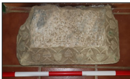
Fig. 7. Elemento constructivo procedente de Santa María del Valle.

Santa María del Valle: en este sitio fue hallada una moneda de oro que lleva a M. R. Martínez a afirmar la existencia de una iglesia visigoda. Actualmente se considera que la construcción moderna reutiliza parte de la antigua iglesia, por cuya tipología ha sido llevada al siglo VIII 26 . Los restos presentes en las inmediaciones nos llevan a afirmar que en dicho solar hubo algún edificio importante pues se han localizado numerosos restos constructivos marmóreos, los cuales, además, parecen poder relacionarse sin ningún género de dudas con el período aquí estudiado.