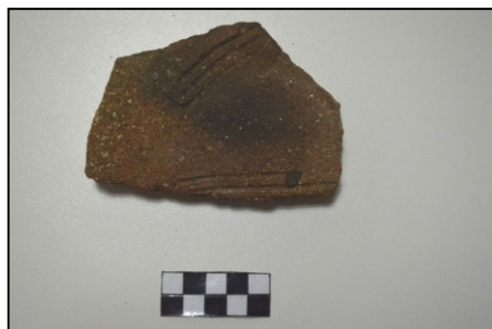
Fig. 5. Artefacto decorado recuperado en La Alcaidía.

Guruviejo: uno de los sitios más destacados de Burguillos del Cerro. M. R. Martínez lo describe como un asentamiento con ocupaciones romana, visigoda y andalusí. Nuevamente, sus informaciones son acertadas 24 . El sitio visigodo parece quedar reducido exclusivamente al cabezo, por lo que no llegaría a la hectárea de extensión. No obstante, no hay que descartar que hubiera una pequeña prolongación de esta ocupación en la falda del mencionado cabezo. A diferencia de los restos de La Alcaidía, no se han