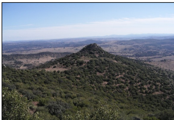
Fig. 6. El cerro de Guruviejo.

recuperado restos de tegulae con decoración. En el caso del Cerro de Guruviejo, son habituales los cordones digitados y las incisiones simples o a peine. A los pies de este yacimiento se encuentra Matapollitos.