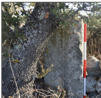
Fig. 3. Restos constructivos de la Fuente del Álamo.

Tanto la teoría de la destrucción de la iglesia por parte de los musulmanes, como la narración de cómo pudo ser este episodio no deben hacer que minusvaloremos el potencial de M. R. Martínez como historiador pues hemos de tener en cuenta en qué fechas fueron redactados sus artículos y el panorama científico imperante en la región.