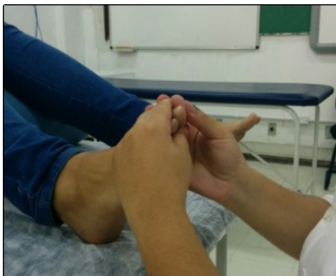
Figura 2. Pressionando o ponto reflexo das glândulas hipotálamo, hipófise e pineal.