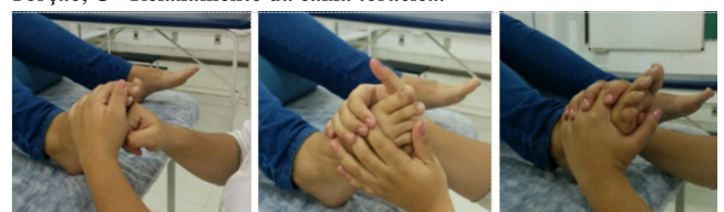
Figura 1. Manobra de aquecimento. A - amassamento metatarsal, B - Torção, C - Relaxamento da caixa torácica.

A sequência da massagem foi: abertura do plexo solar em ambos os pés, manobras de aquecimento iniciando pelo pé direito. As manobras de aquecimento: deslizamento, movimentos circulares dos maléolos, amassamento metatarsal (Figura 1A), relaxamento do pé, balanço relaxante, rotação do hálux e dos artelhos, rotação do pé, torção do pé (Figura 1B), relaxamento do diafragma, relaxamento da caixa torácica (Figura 1C), alongamento e envolvimento do pé.