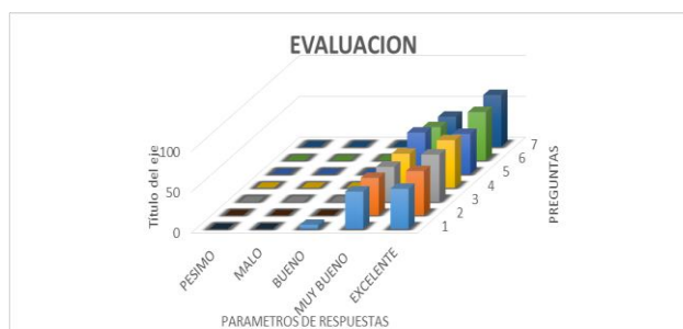
Figura 6. Comportamiento del indicador evaluación