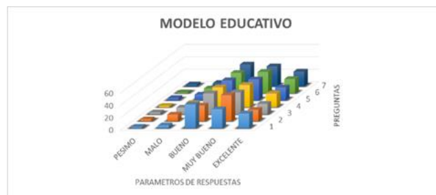
Figura 1. Comportamiento de los indicadores de la encuesta