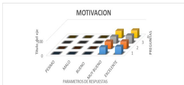
Figura 5. Comportamiento del indicador motivación

En el aspecto de evaluación en la tabla 8 y la figura 6 se ve el comportamiento de cada uno de los indicadores. En la pregunta, ¿considera usted que los parámetros de evaluación, Examen (30puntos), Actuación (40 puntos), investigación (30 puntos), son los más óptimos?, contestaron con un 52,2% que es excelente. Considera usted que los Docentes aplican la calificación de acuerdo a los parámetros establecidos en la UTM, Examen (30puntos), Actuación (40 puntos), investigación (30 puntos), a esta pregunta contestaron que 63,3 que es excelente.