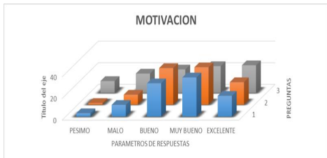
Figura 2. Comportamiento de la encuesta de motivación

En la figura 2 se observa el comportamiento de los criterios de este indicador.