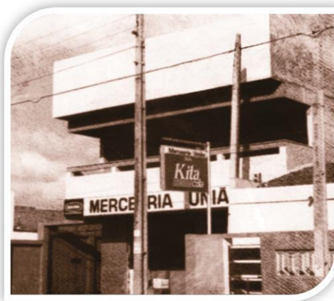
Figura 1. Primeira Loja em 1979. Mercearia União. “O sertão virou mar”