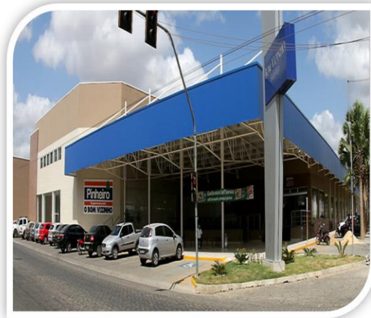
Figura 3. Supermercado Pinheiro “O mar virou sertão”