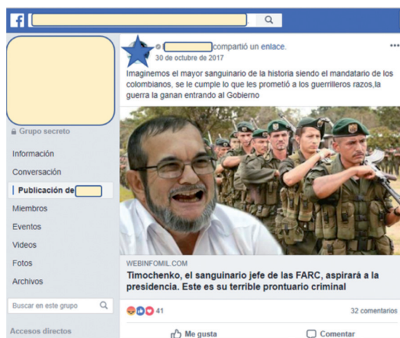
Imagen 2. Mensaje inicial analizado del grupo CDP, publicado por FL. En el análisis CDP1.

Por la disparidad en el número de comentarios, y teniendo en cuenta que en el grupo de Antiuribistas la interacción sobre el tema se concentró en un único post mientras que en ‘CDP’ se presentaron cerca de 10 publicaciones sobre el mismo entre el 30 de octubre y el 02 de noviembre, se definió revisar una publicación más, seleccionada por su evidente violencia verbal y por las 311 reacciones y 47 comentarios que generó. Esta tercera publicación (desde ahora CDP2) es un meme publicado por ‘YM’ que dice: «Que se lance timochenko y toda la cúpula de las FARC pero que se lancen de la Torre colpatria 6 esos malparidos». (SIC) (imagen 3). Para mayor comprensión de estos datos se resumen las características de la muestra en la tabla 1.