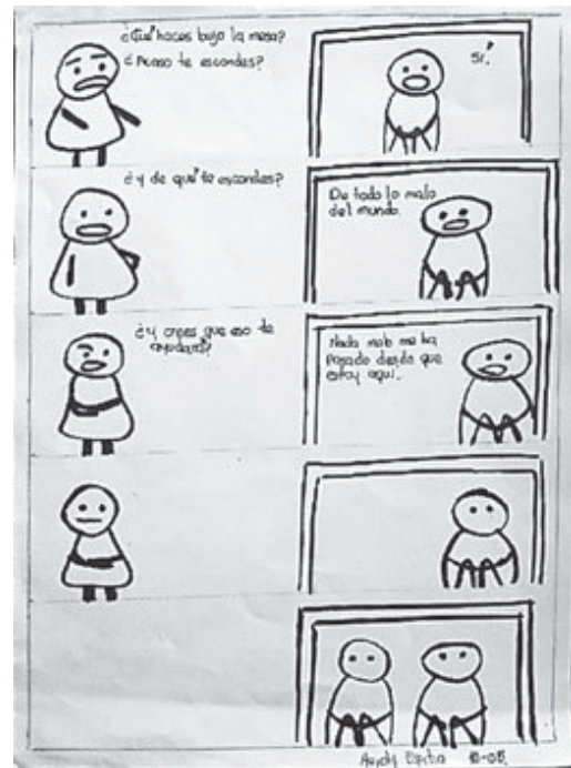
Ilustración 6. Soledad. Estudiante de grado décimo

Este es otro de los desafíos que plantea el uso de las redes sociales a las familias y las escuelas, pues si bien la burla y la risa son emociones y sensaciones que los estudiantes del colegio buscan de manera más asidua, existen, por supuesto, otras “líneas de deriva” que constituyen grupúsculos orientados a la tristeza, líneas SAD, encaminadas a la auto-agresión e incluso el suicidio.