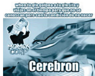
Ilustración 7. Cerebro, una de las mutaciones de Alien, de Ben X, cuyo cuerpo se disipa. A la izquierda, el ícono de Momos Corp ingiere una garrafa de lejía.

Este es otro de los desafíos que plantea el uso de las redes sociales a las familias y las escuelas, pues si bien la burla y la risa son emociones y sensaciones que los estudiantes del colegio buscan de manera más asidua, existen, por supuesto, otras “líneas de deriva” que constituyen grupúsculos orientados a la tristeza, líneas SAD, encaminadas a la auto-agresión e incluso el suicidio.