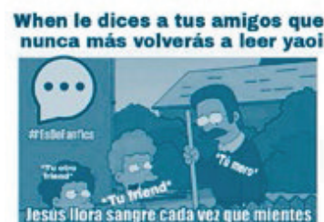
Ilustración 2. Consumo e identidades sexuales en el anime japonés

Dichas prácticas discursivas, construidas sobre nuevas feminidades, mucho más agresivas, no representan una ruptura con masculinidades hegemónicas, e incluso, como señala Demetriou (citado por Connell y Messerschmidt, 2005, p. 844), esta masculinidad hegemónica extrae, bajo ciertas circunstancias, fragmentos (o “memes”) de masculinidades marginales y agencia múltiples sexualidades sin modificar la dominación. Así, pueden convivir, en el capital cultural de los estudiantes, las “etiquetas” soeces en Facebook hacia la mujer que se exhibe, la construcción de relaciones sentimentales orientadas hacia la exhibición en Internet (bajo paradigmas conservadores en relación con el cuerpo de la mujer), con la circulación y consumo de géneros de manga de amor homosexual (como el Yaoi y el Yuri), sin que ello involucre, en principio, su propia orientación sexual genérica o “molar” (Deleuze y Guattari, 1998) 9 .