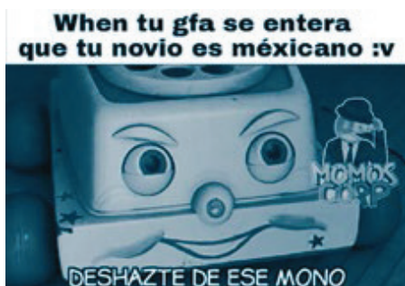
Ilustración 1. Meme a partir de la plantilla “Deshazte de ese mono” (MOMOSCOP), a partir de Toy Story 3