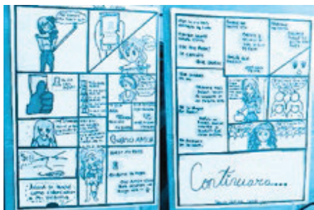
Ilustración 3. Sextorsión y bullying