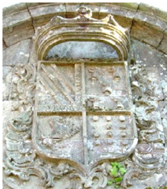
Blasón de los Mosquera y enlazados en la Torre de Guimarey con el repetido coronel.

testamento otorgado en La Coruña el 10-nov-1843 y posterior codicilo de 24-oct-1846 ambos ante Ramón Fernández. Recibió sepultura el día 7 en el cementerio general de Betanzos 148 .