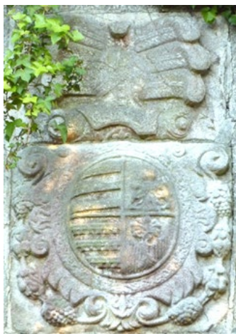
Armas de los Ribera y enlazados en el pazo de Baldomir en Guísamo.