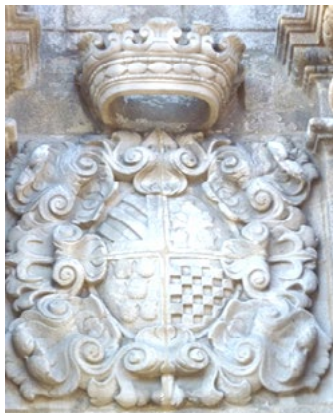
Armas de los Mosquera, Señores de Bentraces, timbradas nuevamente con la corona marquesal, en la fachada de la actual parroquia de San Bartolomé de Pontevedra, antigua iglesia de la Compañía de Jesús, patronato de la familia.