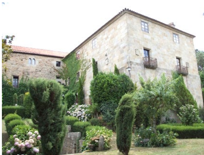
Otra vista del pazo de Bentraces y sus jardines.