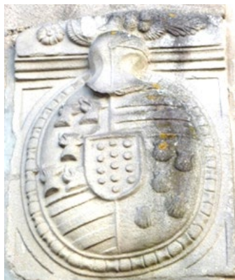
Armas de los Mosquera con los trece roeles de los Sarmiento en el escusón, en la actual plaza de Méndez Núñez nº 5 de Pontevedra.