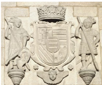
Armas de los Mosquera y enlazados timbradas con el coronel y con el blasón de Sotomayor en escusón, en el palacio de don Gaspar Antonio Suárez Mosquera de Sotomayor, plaza del Teucro, Pontevedra.