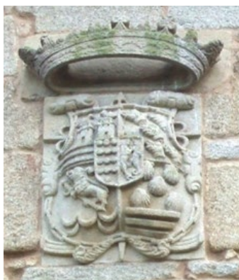
Armas de los Señores de Bentraces timbradas con el coronel. En el segundo cuartel las correspondientes a Mosquera: cinco lobos de sable en campo de plata. Pazo de Bentraces, Orense.

Ejerció los patronatos familiares referentes a la capilla de Nuestra Señora de la Piedad de la parroquia de San Bartolomé y los correspondientes a los conventos de Santo Domingo y San Francisco, todos ellos en Pontevedra, así como los de la parroquia de Villar de Payo Muñiz y la de Allariz, en Orense.