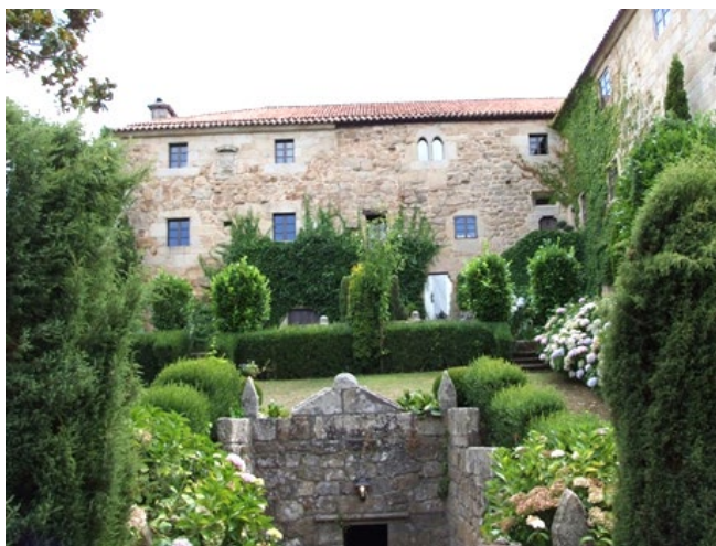
El pazo de Bentraces y sus jardines.