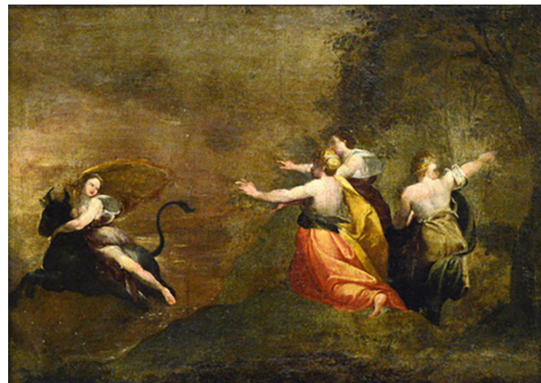
Figura 1 El rapto de Europa . Francisco José de Goya y Lucientes (1772)

cosa a quien está sujeto a ella. Más allá de lo que propone Weil, podríamos pensar que también lo exalta “intencionalmente” para convertirlo en mártir o en héroe, justificando con ello, en el caso de las figuras femeninas de la historia y la mitología, una perpetuación de la asignada condición sacrificial para satisfacción de los hombres, tal como la épica griega narra, pero también, como “naturalización” de la violencia “justificada” en la belleza femenina que motiva el rapto de sus cuerpos. Lo anterior nos conduce inevitablemente al precipicio donde el ser femenino como sujeto es anulado y su valía, su telos , no es más que el de ser un instrumento para saciar el desahogo el deseo masculino. Con este panorama, nada más allá de eso importará para los juegos de la guerra y para el arte. En el arte, la imagen muestra el rapto, pero no lo cuestiona sino que lo embellece.