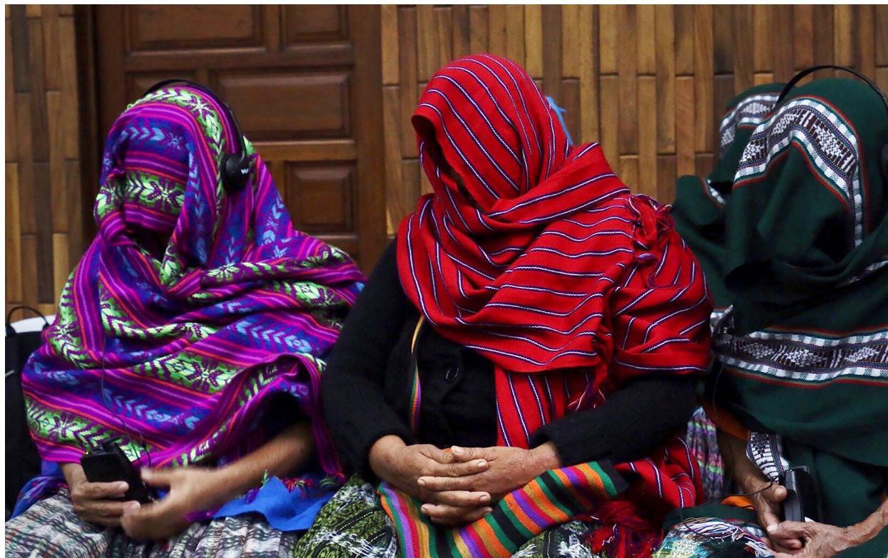
Figura 5 Mujeres de Sepur Zarco, Guatemala (2015)