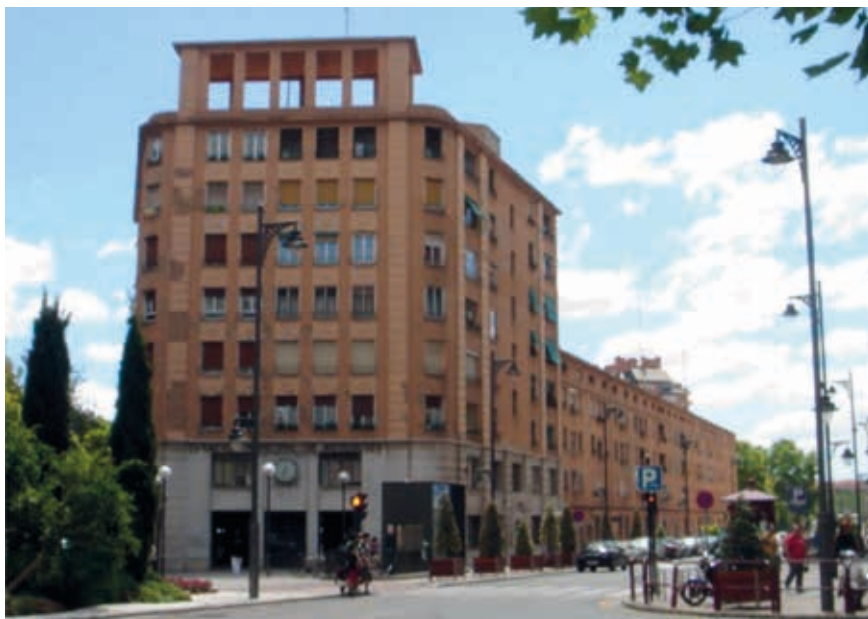
Lám. 1. Edificio de viviendas y Estación de autobuses, A/ España 1 a 11 y A/ Pío XII 2 a 10, Logroño, J. Carceller y Luis González, 1949.