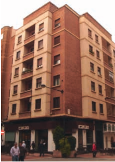
Lám. 5. Edificio de viviendas, c/ Doctores Castroviejo 16 esquina a/ Juan XXIII, Logroño. J. Carceller, 1960.