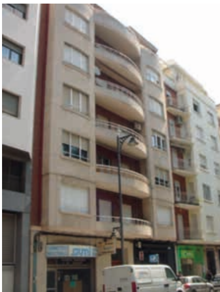
Lám. 3. Edificio de viviendas, c/ Villamediana 9, Logroño. J. Carceller, 1956.