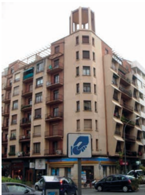
Lám. 2. Edificio de viviendas, a/ de La Paz esquina a/ Juan XXIII, Logroño. J. Carceller. 1955.

lizarla, con mayor superficie de paño cerrado y menos hueco consiguiendo que el templete le dé más presencia aunque los huecos queden de peores proporciones. La imagen de proyecto, sin templete de remate, se antoja incompleta en esa esquina, además de marcar un hito en su emplazamiento,