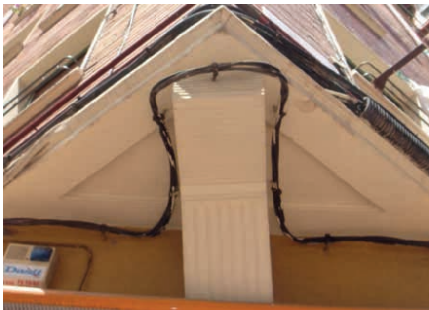
Lám. 4. Edificio de viviendas, a/ Pérez Galdós 74, detalle de la esquina, Logroño, J. Carceller 1958.

Otra obra es la correspondiente al número 74 de la avenida de Pérez Galdós 45 . Jaime Carceller resuelve las irregularidades del solar con oficio e intentos de agrupar los servicios. La sensación de orden la da un alzado discreto y sobrio, en el que los elementos de los huecos y sus entregas, la serenidad de los paños de ladrillo y las buenas proporciones de todo el conjunto y el episodio de la volumetría general y en esquina logran una dignidad urbana apreciable. En el vértice, una ménsula de peculiar aire clásico es toda una curiosidad que hace ver la preocupación por dar sentido a las partes del edificio que se quedarían sin tratar pero que están cercanas a la visión del viandante como en el caso de los sofitos (Lámina 4).