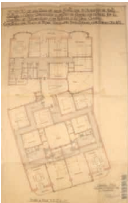
Fig. 3. Edificio de viviendas, c/ Villamediana 9, planta tipo de viviendas, Logroño. J. Carceller, 1956 (AML, PU 647/1956).