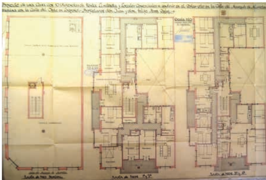
Fig. 4. Edificio de viviendas, c/ Beratúa 2, plantas baja y de 1º y 2º piso, Logroño, J. Carceller 1958 (AML, PU 420/1958).

una enorme variedad en las plantas. Algunos de los pisos tienen pasillo de planta de ensanche, otros más pequeños con cocina-comedor con paso a dormitorio o siendo el centro de toda la casa y entrada; en otros se accede al mismo desde un vestíbulo alargado en un pasillo. Esta variedad de encaje muestra una enorme flexibilidad a la que acompañan la profundidad de las terrazas amplias y un gran patio de luces. Las piezas encajan con posibilidad de cambios en uso o estancias para uno u otro piso y sin asomo de simetría o composición de reminiscencias historicistas. Siempre que puede agrupa los servicios, pero el modo de extenderse su superficie y la amplitud de paños al exterior hace que se dispersen un poco e incluso salga a fachada y terraza alguna cocina. La manera de articular las diferentes viviendas entre sí o los propios espacios de cada una es bastante libre, permitiéndole cumplir con programas más o menos exigentes con el número de dormitorios o el tamaño, e igualmente no evita el zonificar si le es posible. Tanto el aspecto final como las proporciones que logra a una y otra fachada, junto con la profundidad de sus terrazas y la planta que parece tender hacia la expansión de los largos paños de cerramiento para aprovecharlos (incluye galería de paso a la que dan algunos servicios previa al patio), hacen de