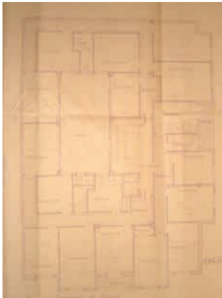
Fig. 5. Edificio de viviendas, c/ Doctores Castroviejo 16, planta tipo de viviendas, Logroño. J. Carceller, 1960 (AML, PU 380/1960).