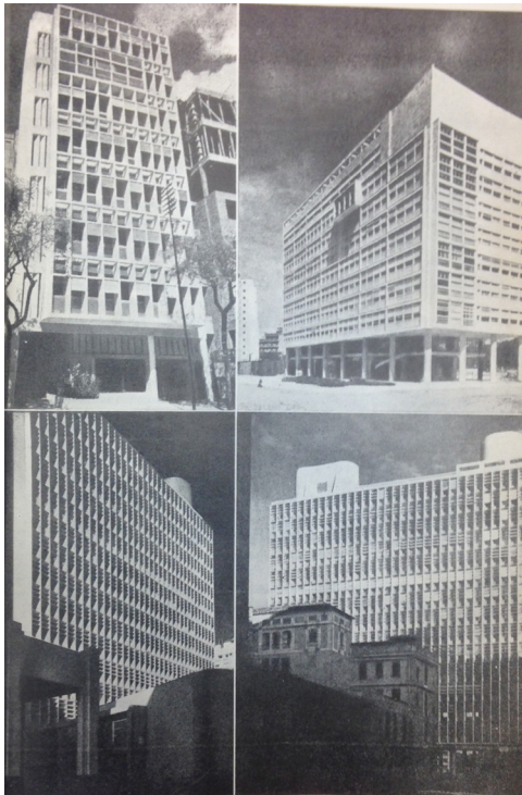
Figura 03. Fotos del departamento para arquitectos, Edificio IRB y Ministerio de Educación y Salud, en Zevi (1954).