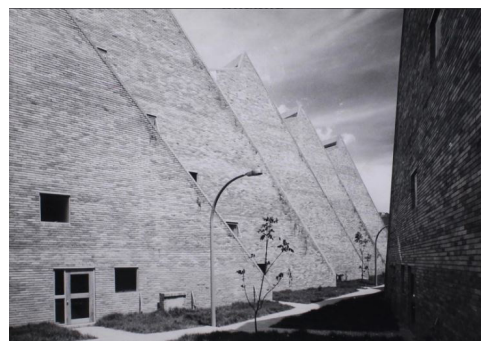
Figura 10. Complejo de Vivienda Social en San Cristóbal, Colombia, en Latin America in Construction, Architecture 1955-1980 .