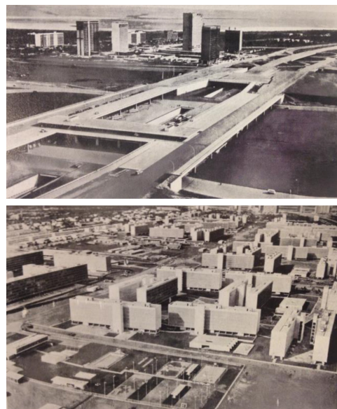
Figura 07 y 08. Fotos de Brasilia en Benevolo, (1999).

Esta nueva capital ocupó también un lugar significativo entre las tímidas menciones latinoamericanas incorporadas en las nuevas ediciones de la historia de Giedion. A partir de la cuarta (1962) el autor agrega una introducción donde trata el estado de la arquitectura contemporánea. El autor establece ser consciente de que la arquitectura moderna se ha expandido y no pueda ya ser entendida únicamente a partir de la experiencia de una acotada región del mundo. Reconoce en este sentido la existencia de dos dimensiones en el desarrollo de la arquitectura, una basada en las características arquitectónicas arraigadas a la cultura local, y otra basada en la expresión y concepción espacial moderna. La nueva arquitectura no se entiende ya como internacional, sino que el diálogo entre estas dos dimensiones propicia el desarrollo de obras que, bajo las mismas ideas universales,