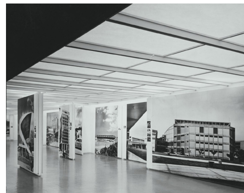
Figura 05 y 06. Fotos del departamento para arquitectos, Edificio IRB y Ministerio de Educación y Salud, en Zevi (1954).