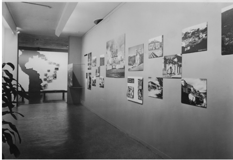
Figura 01. Exposición Brazil Builds, MoMA, Nueva York, 1943.

en la historia. Como señala Shmidt (2012) la caracterización de “América Latina, como parte de un Tercer Mundo situado -según la teoría de la dependencia- en la periferia (...) está en la base de la construcción de las historias de la arquitectura (...) desde la perspectiva geocultural.” (p. 323)