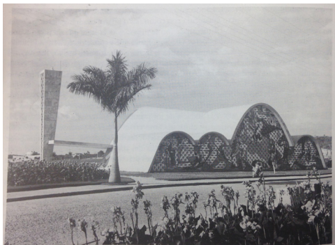
Figura 04. Foto de la Iglesia de Pampulha en Pevsner (1994).

Sin embargo, esta difusión no se vio mayormente reflejada en los nuevos relatos historiográficos en los que, si bien la exposición pudo haber influido en la predominancia de las apariciones brasileñas en comparación con la producción arquitectónica del resto de la región, se estuvo lejos de mostrar una imagen completa de su arquitectura. Pero mucho más lejos se estuvo de lograr un entendimiento de la arquitectura moderna latinoamericana en su conjunto. El italiano Zevi en su Historia de la arquitectura moderna (1950) fue el primero que hizo mención a esta región del mundo en una primera edición, sin embargo, esta resulta realmente mínima, al igual que la que realiza Pevsner siete años después en la quinta edición (1957) del libro Breve historia de la arquitectura europea. Resulta sorprendente, como ambos autores construyen imágenes considerablemente distintas de la arquitectura latinoamericana. Mientras que Zevi muestra como esta sigue los lineamientos internacionales del racionalismo moderno provenientes de Europa y Estados Unidos, Pevsner destaca obras cuyas formas considera se alejan de la simpleza geométrica, resultando irracionales y exuberantes, e implicando incluso el riesgo de corromper el modernismo occidental. (Del Real, 2015)