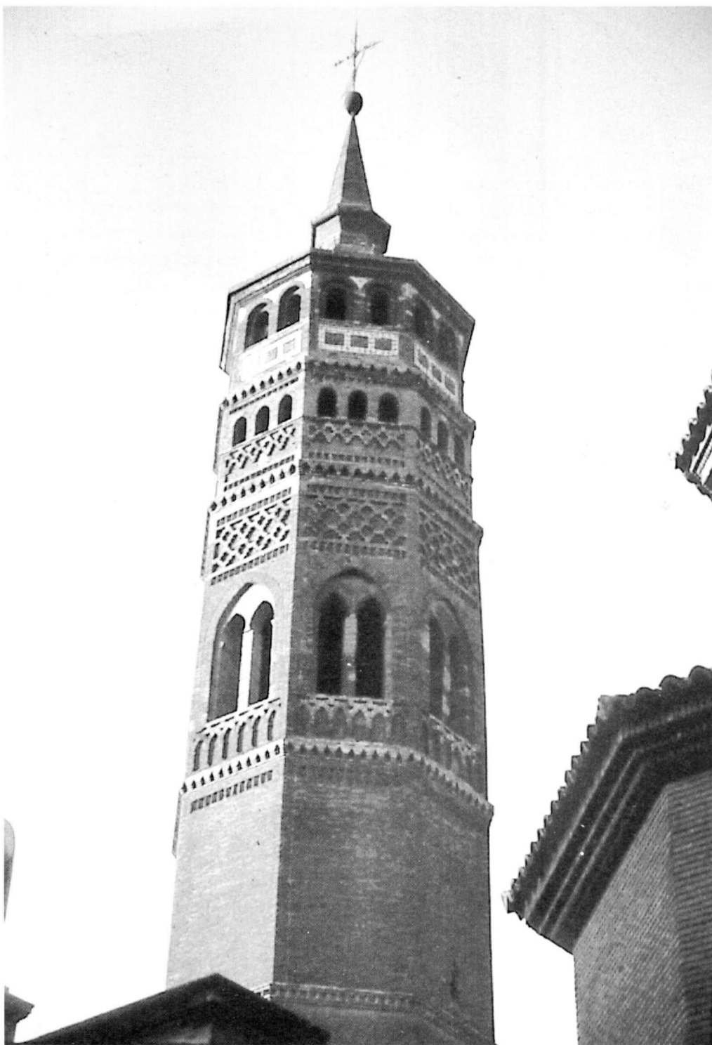
Campanario de la iglesia de San Pablo. Zaragoza.