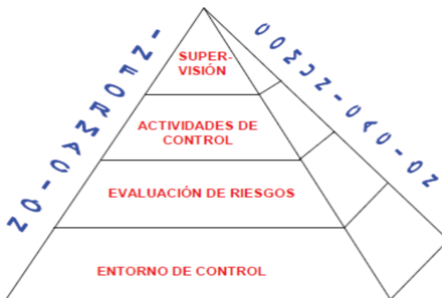
Imagen N°1 Modelo de Control COSO

El marco conceptual de control interno o de registro de control empresarial más reconocido es el modelo COSO propuesto en 1992 por el Committee of Sponsoring Organizations of the Treadway Commission (COSO), (Parra, 2014, p.131). A continuación se presenta el modelo de control COSO