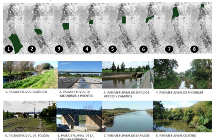
Figura 3. Unidades de paisaje