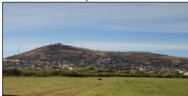
Imagen 4. Comunidad de La Palma y la orilla del Lago de Chapala 2015