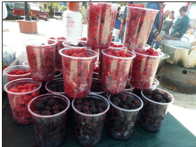
Imagen 2. Venta de frutillas en plaza de San Luis Cosalá, Jocotepec, Jalisco