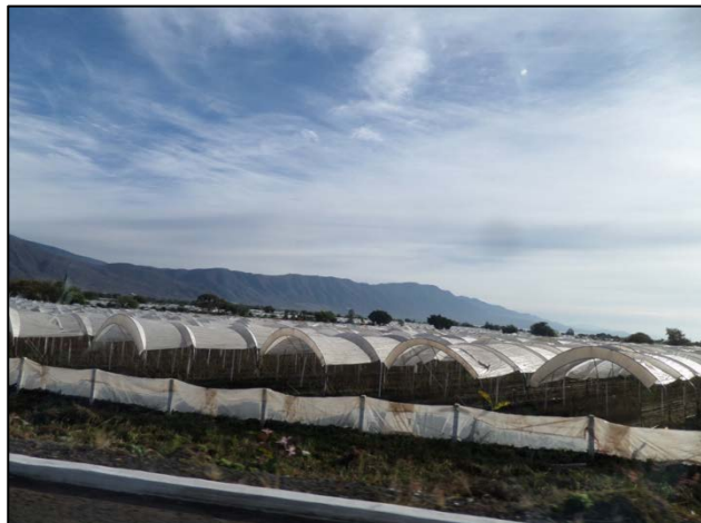
Imagen 3. Macro túneles en cultivos de berries junto a la carretera, Tuxcueca, Jalisco