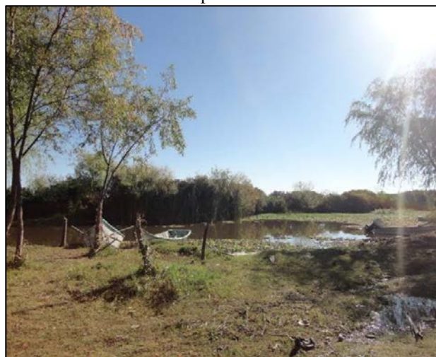
Imagen 5. Muelle histórico de La Palma en el Lago de Chapala 2015