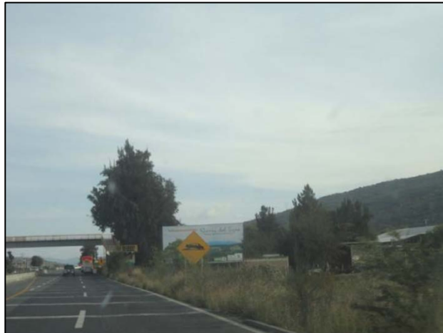
Imagen 1. Ampliación carretera Jocotepec - Mazamitla