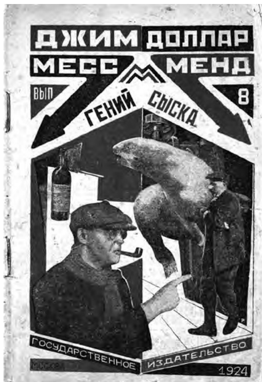
▪ El genio Siska , Un yankee en Petrogrado Vol. 8 por Marietta Saginya, 1924 | Alexander Rodchenko

Sobre el primer tema, el autor sostuvo la tesis de que la URSS hacía uso de un capitalismo de Estado, y advirtió que esa podía ser una fase de desarrollo contemporánea del capitalismo a la que tendieran otros países. Sobre el segundo tema, defendió —contra la mayoría de los autores marxistas— una agenda política reivindicativa propia y autónoma para el proletariado negro de Estados Unidos, de acuerdo con las condiciones específicas de su explotación, atravesadas por un intenso racismo socio-estructural que el proletariado blanco no sufría. Además, James escribió sobre diversas causas como las luchas de las mujeres contra el patriarcado y las organizaciones juveniles, o las movilizaciones anticoloniales que recorrían el mundo en su época. En todas sus reivindicaciones aparecía la idea de autodeterminación de las masas como un elemento clave, presente en todas las revoluciones a lo largo de la historia. Frente a los marxismos ortodoxos defensores de fórmulas vanguardistas y estatistas, el marxismo independiente de James siempre apostó por la autoorganización proletaria y la profunda confianza en que, siguiendo a Lenin, “todo cocinero puede gobernar”.