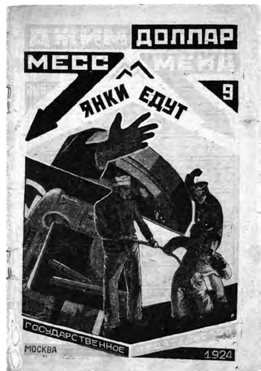
▪ Yankee vete a casa , Un yankee en Petrogrado Vol. 9 por Marietta Saginya, 1924 | Alexander Rodchenko