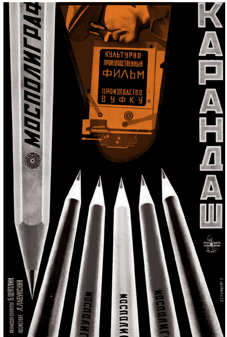
■ El Lápiz , 1928 | Hermanos Stenberg

En cuanto a la opinión de James sobre la situación de explotación y dominación de la población negra en Estados Unidos y su potencia revolucionaria, existen dos documentos clave: sus conversaciones con Trotsky de 1939 y su espléndido artículo “The Revolutionary Answer to the Negro Problem in the US”, publicado en 1948 en la revista de la Cuarta Internacional. El primer documento consiste en la transcripción de la visita que hizo la comitiva del Partido Socialista de los Trabajadores de Estados Unidos en abril de 1939 a Trotsky en su casa de Coyoacán, en la Ciudad de México, donde se encontraba como exiliado político. Dicha comitiva estaba liderada por James, quien ya firmaba con su pseudónimo Johnson y llevaba apenas cinco meses en Estados Unidos. El documento se divide en dos grandes partes: la primera dedicada a la cuestión negra en Estados Unidos y la segunda a la discusión de los problemas y perspectivas de la Cuarta Internacional en el panorama mundial. La primera parte incluye un debate sobre la autodeterminación de los movimientos negros. La discusión expone el debate entre James, Trotsky y Charles Curtiss, cada uno con una posición diferente. James apoyaba la autodeterminación en relación con la acción política autónoma de