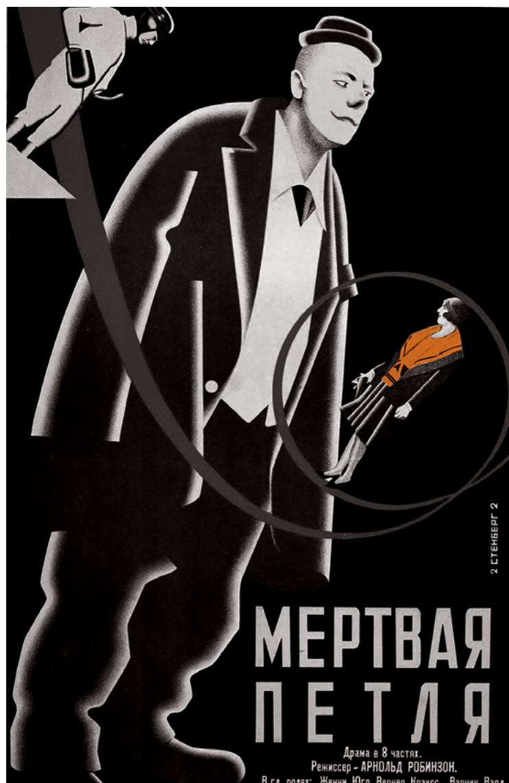
■ Muerte en bucle , película de Arthur Robison, 1928 | Hermanos Stenberg

Sobre la primera línea se destaca el profundo respeto que James tiene hacia la figura de Hegel, único que merece en el texto la categoría de ‘maestro’. Brevemente señala que Hegel era en efecto políticamente