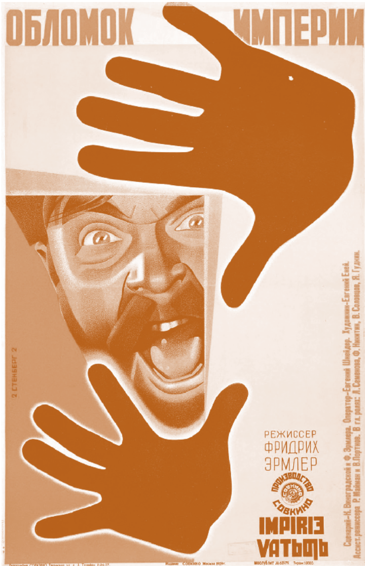
■ Fragments of an imperio, película de Friedrich Ermle, 1929