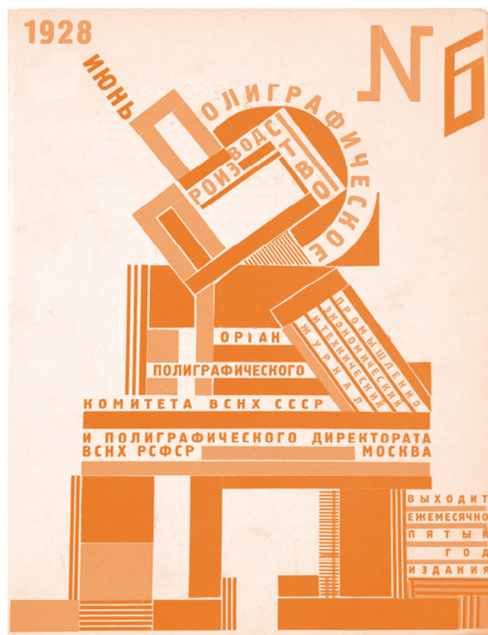
■ Industria de la impresión, 1928 | Elbrus Gutnov

entre el proletariado negro y el blanco para conseguir una acción conjunta efectiva y revolucionaria. El argumento estaba sustentado en numerosos ejemplos históricos de Estados Unidos y el mundo donde negros y blancos habían luchado juntos en la consecución de diversos hitos revolucionarios (James; Trotsky; Curtiss, 1984: 43). Sin embargo, la argumentación no consiguió convencer a Trotsky, quien seguía viendo con buenos ojos apoyar la iniciativa separatista negra como un paso revolucionario hacia el socialismo mundial; tampoco convenció a la mayoría de líderes de movimientos negros, quienes apoyaban la idea de que la población negra en Estados Unidos era como una “colonia interna” al modo de Cataluña en España, lo cual funcionaba bien políticamente en un contexto más general de alianzas con las luchas antiimperialistas de África y las Antillas. James debatió esta cuestión extensamente en los años sesenta y setenta en