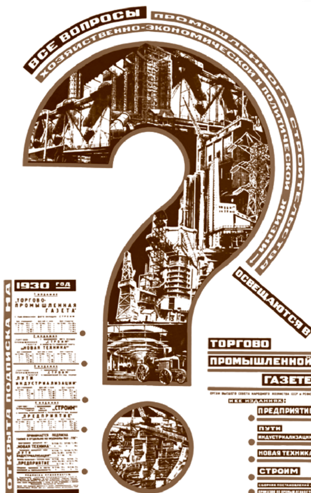
■ Se tratan todos los temas relacionados con la construcción industrial, la economía y la política, 1930 | Fedor Slutsky

Race and class, therefore, in the traditional paradigm of ‘left’ political theory, are seen as discrete and conflicting notions. In James’s analysis the issue is not about which is primary or secondary, but rather that the self-activity of blacks brings them into conflict with the bourgeois state and that the dynamic of this logic is the struggle for socialism. In other words, the issue is one of moments in historical process. Race and class could not be separated into discrete, contradictory realities; they were an integral part of the experiences of the African-American population (Bogues, 1997: 95).