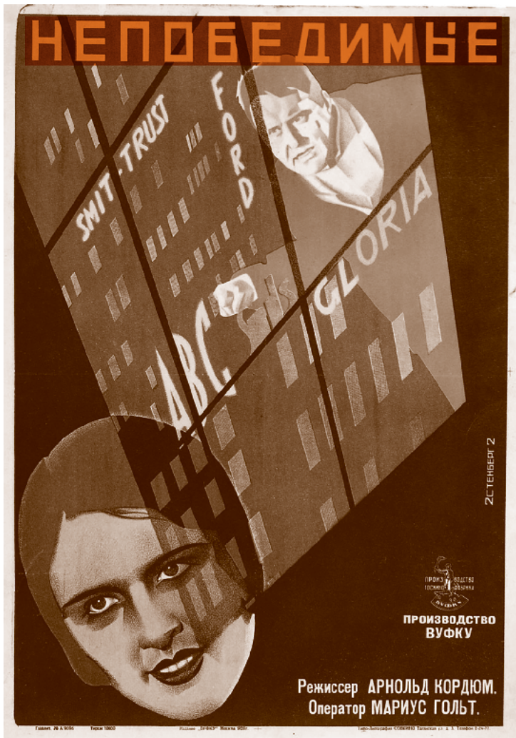
■ El invicto , película de Arnold Kordium, 1928 | Hermanos Stenberg

Trabajadores de Estados Unidos (Bogues, 1997: 76). James consideraba al racismo como un producto del capitalismo, heredero del sistema esclavista que se debía exterminar. Para ello era necesaria una lucha concreta contra el problema, pero articulada a las luchas socialistas proletarias del mundo.