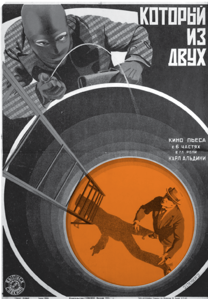
▪ ¿Cuál de los dos?, película de Nunzio Malasomma, 1927 | Hermanos Stenberg

Por último, después de haber mostrado el método dialéctico y sus aplicaciones acertadas y desacertadas, el libro expone un ejercicio de razonamiento para los problemas de 1948, y propone una reactualización del universal socialista desde el entendimiento de las contradicciones y bases materiales de los movimientos proletarios contemporáneos. James bautiza este “nuevo universal” como una “nueva noción”, con énfasis en la autodeterminación de las masas, el fortalecimiento de una “espontaneidad organizada” y la reactualización de la idea leninista de partido en su conformación directa desde las masas y uniones obreras, que la distanciaba de la apuesta por la vanguardia de Trotsky: