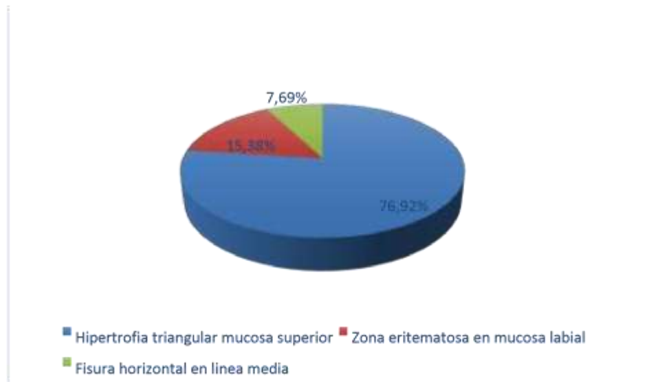
Figura 3. Prevalencia de las lesiones en labio superior