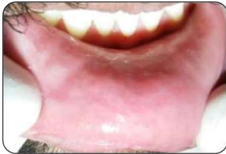
Figura 4. En mucosa labial se encontró en zona central lesión depresiva asintomática.