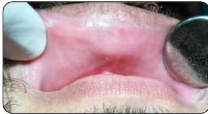
Figura 2. Se observa en mucosa labial superior alteración hipertrófica con forma triangular asintomática.