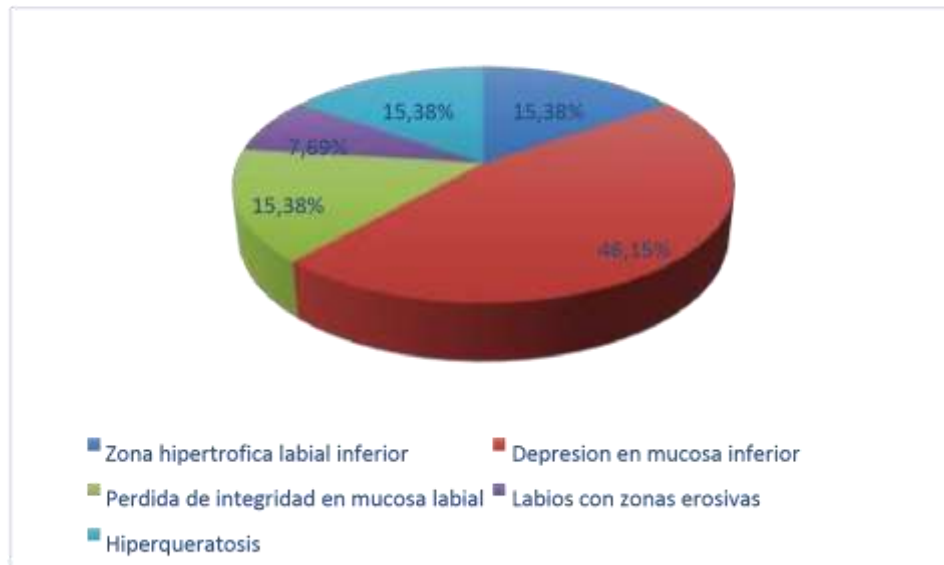
Figura 5. Prevalencia de las lesiones en labio inferior

También se encontraron alteraciones neuromusculares tales como distonía focal e hipermovilidad de la lengua presentados por un músico que ejecutaba tanto gaita como clarinete. Este músico manifestó la suspensión de la interpretación debido a la pérdida de control motor en zona peribucal. Otras de las alteraciones encontradas fueron: xerostomía, dolor en orofaringe, caries y gingivorragia por la mayoría de los examinados. Además se evidenciaron ruidos en ATM en los músicos con un porcentaje de 69 %.