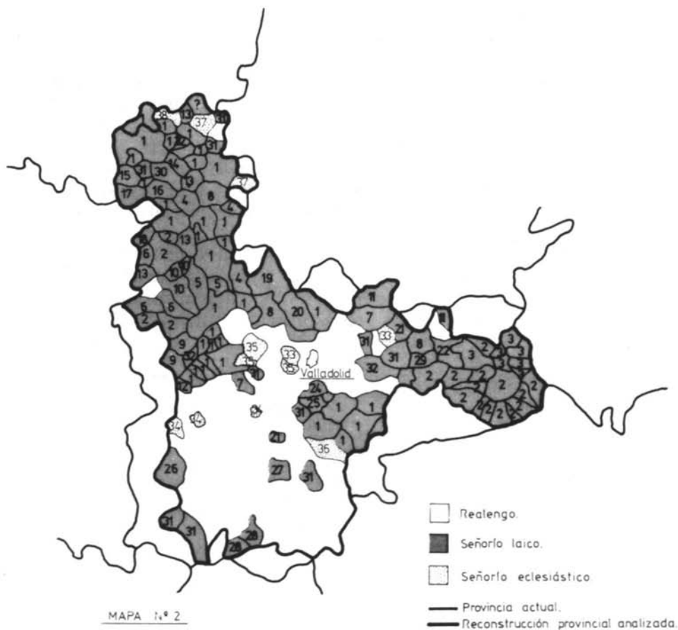
Señorío y realengo en Valladolid (1752)