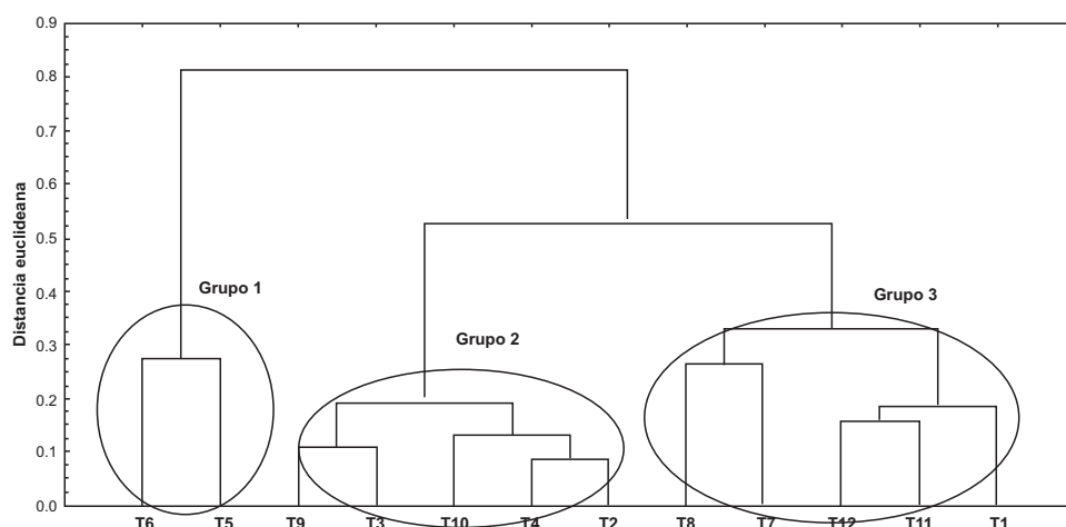
Figura 1. Clasificación jerárquica de los diferentes tratamientos estudiados mediante el método de Ward T1: Acaia/Robusta (inoculado), T2: Acaia/Robusta (no inoculado), T3: Catuaí/Robusta (inoculado), T4: Catuaí/Robusta (no inoculado), T5: Icatú Vermelho/Robusta (inoculado), T6: Icatú Vermelho/Robusta (no inoculado), T7: Ibairi/Robusta (inoculado), T8: Ibairi/Robusta (no inoculado), T9: Mundo Novo/Robusta (inoculado), T10: Mundo Novo/Robusta (no inoculado), T11: Caturra Varmelho/Robusta (inoculado), T12: Caturra Varmelho/Robusta (no inoculado).

inoculado); Grupo 2, formado por Mundo Novo/Robusta (inoculado y no inoculado), Catuaí/Robusta (inoculado y no inoculado) y Acaia/Robusta (no inoculado); y finalmente el Grupo 3, formado por Ibairi/Robusta (inoculado y no inoculado), Caturra/Robusta (inoculado y no inoculado) y Acaia/Robusta (inoculado) (Figura 1).