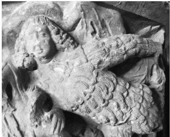
Fig. 9.- Capitell d'un arc del santuari del Tallat, actualment al Palau Maricel de Sitges.