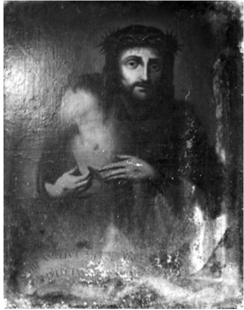
Fig. 7.- Crist mostra una llaga, Museu del Monestir de Poblet.

d'un negatiu de vidre que no compta amb cap identificació [...] res indica on es troba el quadre i realment el títol no és adient”. 19 En tot cas, la foto en qüestió, que avui publiquem per primera vegada, permet observar amb més nitidesa la pintura, que vaig datar del segle XVII de forma genèrica. 20 Continuo pensant que és una pintura de l'època barroca, per tant, molt posterior a la mort del baró bellpugenc. Caldria adjudicar-la a un pintor hispà que segueix de lluny la corrent pictòrica caravaggista. Un artista, que podríem batejar com “Mestre del retrat de Ramon de Cardona”, a qui també s'ha d'atorgar la realització d'una altra tela, un “Crist mostrant una llaga” (fig. 7), que es conserva al magatzem del Museu del Monestir de Poblet (107 x 83 cm i número d'inventari MPO 00088). A part de la semblança d'estil en les faccions del rostre i les mans, ambdues obres també tenen un filacteri a la part inferior del quadre, amb un text escrit en lletres capitals. Un text de molt difícil lectura: impossible pel que fa al retrat de Ramon de Cardona, i algunes lletres es poden intuir al quadre de Poblet (l'epigrafi s'inicia amb “QVID AMPLIVS [...] / DILECTAS [...]”). 21 Per tant, el retrat bellpugenc podria tenir unes mides similars.