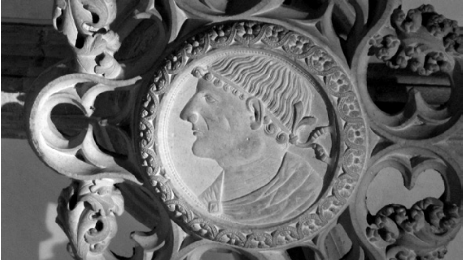
Fig. 5.- Bust de Ramon de Cardona, clau de volta de la sala capitular del Convent de Bellpuig.