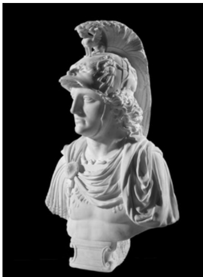
Fig. 2.- Bust de Mart, obra de Giovanni da Nola, galeria d'art Colnaghi a Londres (foto: Colnaghi).

L'any 2001 vaig publicar un extracte del testament de Ramon de Cardona. 6 Aquest resum, redactat en llengua castellana, es conservava a l'índex de les escriptures que hi havia a l'arxiu de Bellpuig. Pel qual ja sabem que fou realitzat el 24 de febrer de 1522 davant el notari Francesco Nubulis, i la publicació fou l'endemà de la seva mort, l'11 de març del mateix 1522, davant el notari Aniello Giordano.