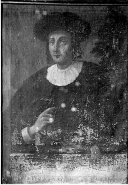
Fig. 6.- Retrat de Ramon de Cardona, obra desapareguda.