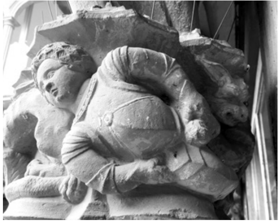
Fig. 8.- Representació de Ramon de Cardona (?), detall d'un capitell al claustre del Convent de Bellpuig.