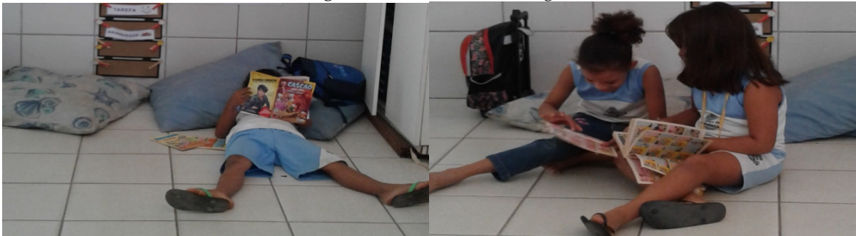
Fotografia 5 – As crianças e os gibis