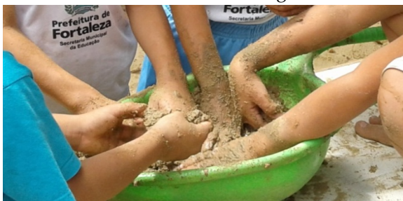
Fotografia 4 – Vivências no tempo de parque

O “tempo de parque” era um momento no qual, geralmente, as crianças do Infantil V encontravam-se com a turma do Infantil IV. No parque, reinava a brincadeira, o movimento, as interações. Havia algumas narrativas que se repetiam, como brincar de fazer meleca (misturar água e areia com as mãos) e bolos de areia (para cantar parabéns para as professoras ou para os colegas), minhoca de fogo, “suga-sangue”, zumbi ou “perna cabeluda”, brincadeiras parecidas com pega-pega.