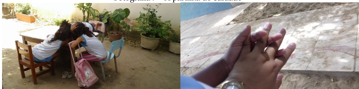
Fotografia 7 – A partilha do cuidado

As crianças cuidavam de si e dos outros, também, na partilha dos afetos, na troca dos “segredos secretos”, quando acolhiam com um olhar, um abraço ou um toque, ou ofereciam seus brinquedos, flores encontradas no jardim, anéis de papel e até seus desenhos.