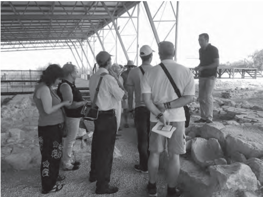
Visita guiada a Fuente Álamo, Puente Genil