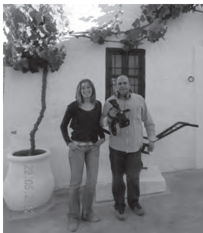
Banderola X Aniversario, y reporteros de Priego TV frente a la Casa-Museo