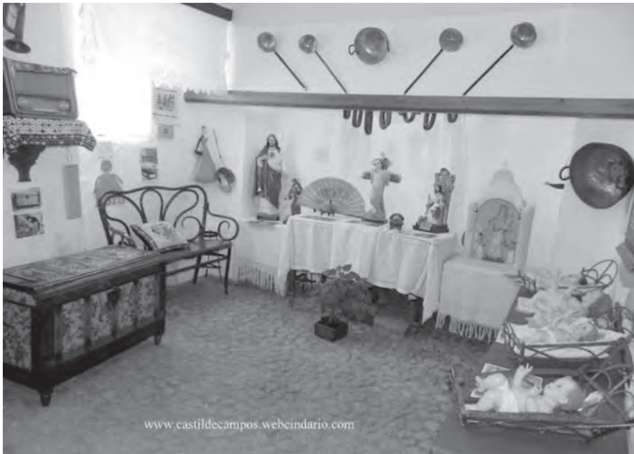
Exposición de enseres restaurados en el taller de restauración organizado por la E.L.A. en el verano de 2010