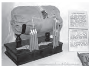
Alcoba, hatillo del recién nacido, y encaje de bolillos de la Casa-Museo de Castil de Campos.