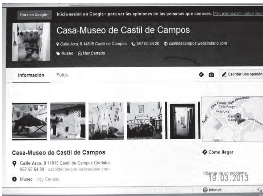
Página del buscador de Google con información de la Casa-Museo de Castil de Campos en 2013

-En julio de 2014 se enviaba un correo electrónico al webmaster y a la Alcaldesa del Excmo. Ayuntamiento de Priego, para que se incluyese un enlace a la web de la Casa-Museo de Castil de Campos, en la sección de su renovada página web consistorial en la que aparecen los enlaces a