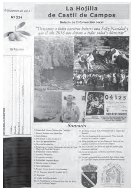
Portada del número extraordinario del XX Aniversario, y portada del último número de 2015, de La Hojilla de Castil de Campos, boletín de información local editado por la Asociación Cultural “Amigos de la Casa-Museo de Artes y Costumbres Populares de Castil de Campos”, con periodicidad mensual