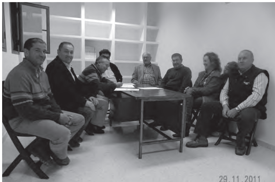
Firma de la cesión del inmueble el 29 de noviembre de 2011