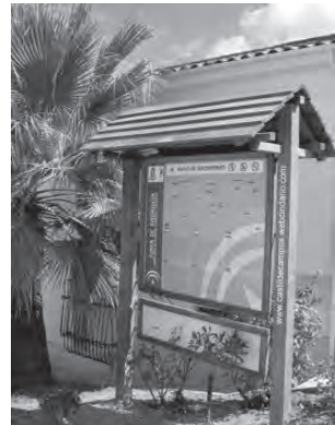
De arriba abajo y de izquierda a derecha: Fuente de la Dehesa, Fuente y Abrevadero del Pozo Rey, Cueva del navazo de los Mármoles, y panel de la calle La Fuente con información en castellano e inglés de las rutas senderistas de Castil de Campos: ruta de las cuevas, ruta de las torres, y ruta de las ermitas y miradores.