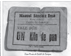
Mechero de yesca, cántaro, y vale por un kilo de pan de la Casa-Museo de Castil de Campos