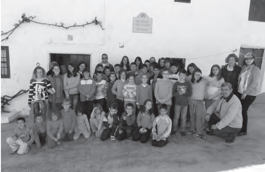
Visita del Colegio Público Rural Tiñosa a la Casa-Museo en 2012 acompañados por sus maestros y maestras