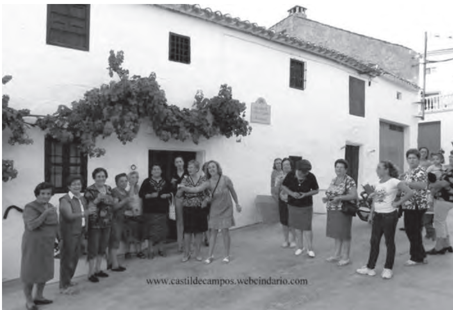
Participantes en el taller de restauración tomando chocolate y café frente a la Casa-Museo de Castil de Campos