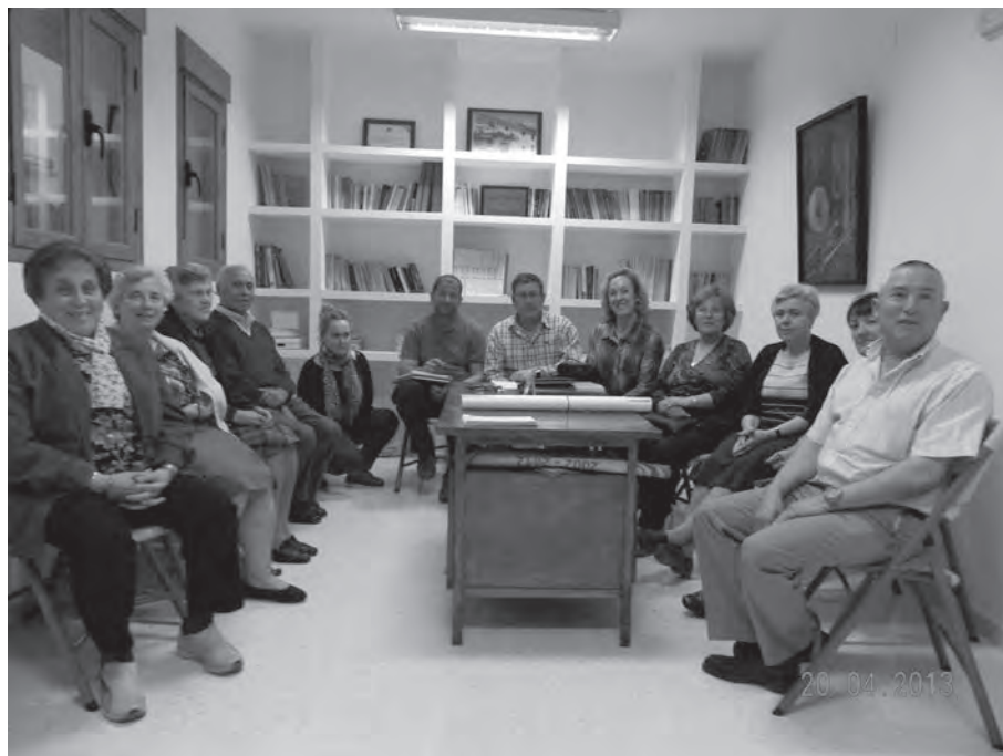
Asamblea de los Amigos y Amigas de la Casa-Museo de Artes y Costumbres Populares de Castil de Campos, 23 de abril de 2013, en su nueva sede de la C/ Arco

Para el mantenimiento de la Casa-Museo se cuenta con los servicios de limpieza del Ayuntamiento de la E.L.A. de Castil de Campos, que limpian la Casa-Museo una vez a la semana.