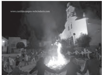
Fachada de la Casa-Museo, Fandanguillo de abajo, procesión del cochinito de San Antón, y coros durante la noche de las candelas