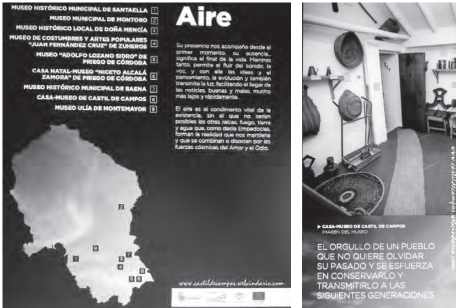
Paneles de la exposición de la Diputación. Fotos de la Asociación Adroches

cia de los Museos de Córdoba según su relación con los cuatro elementos: tierra, aire, fuego y agua. La exposición provincial se completó con la edición de un catálogo en el que se recogen las piezas más relevantes, así como los museos de cada uno de los territorios que integran la provincia de Córdoba, en colaboración con los museos y los Grupos de Desarrollo Rural de la provincia. Este catálogo ha servido para contextualizar el museo en el territorio, entendiendo que su situación y piezas catalogadas forman parte de la historia de cada uno de los territorios de la provincia según su paisaje, su historia y sus recursos endógenos.