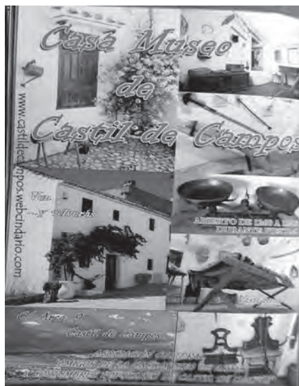
Publicidad del programa de Feria 2014

bién se está abriendo durante el primer fin de semana de octubre con motivo de las Fiestas en honor de Ntra. Sra. la Virgen del Rosario, Patrona y Alcaldesa Perpetua de Castil de Campos, y durante la primera semana de agosto, con motivo de la celebración de la Semana Joven organizada por la E.L.A. Para visitas concertadas se facilita el teléfono del Ayuntamiento de la Entidad Local Autónoma de Castil de Campos: 957 556 420.