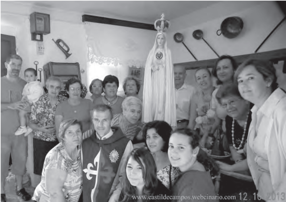
La Virgen de Fátima peregrina visita la Casa-Museo, 12 de octubre de 2013