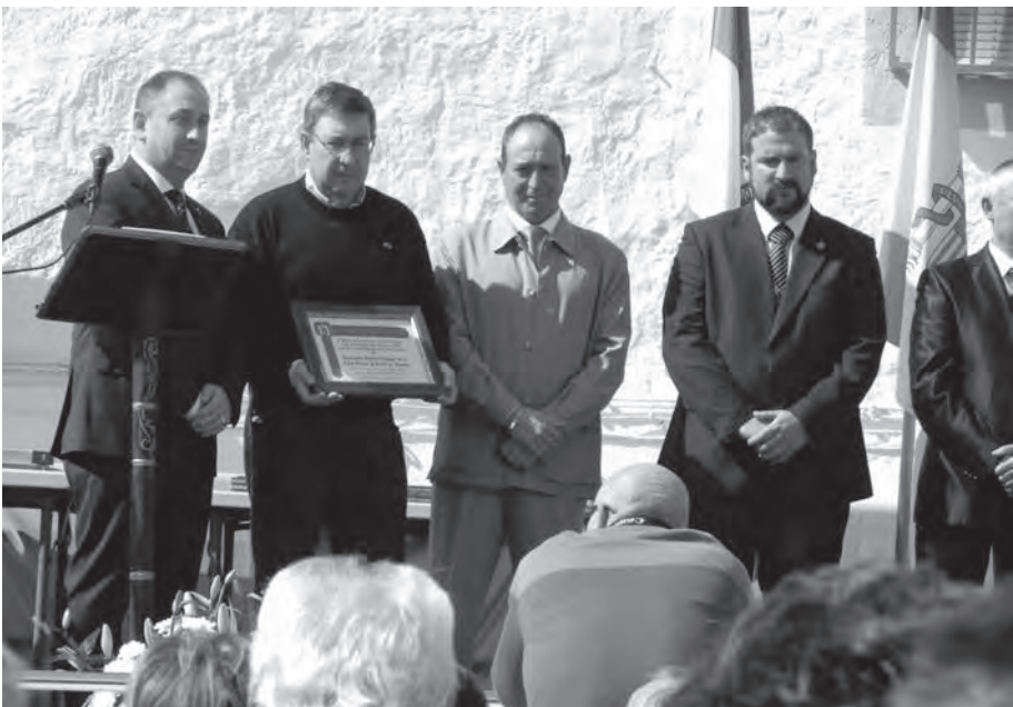
El Presidente de la Asociación Cultural "Amigos de la Casa-Museo de artes y costumbres populares de Castil de Campos, recogiendo la distinción, junto a Alcalde y los Vocales de la E.L.A. de Castil de Campos