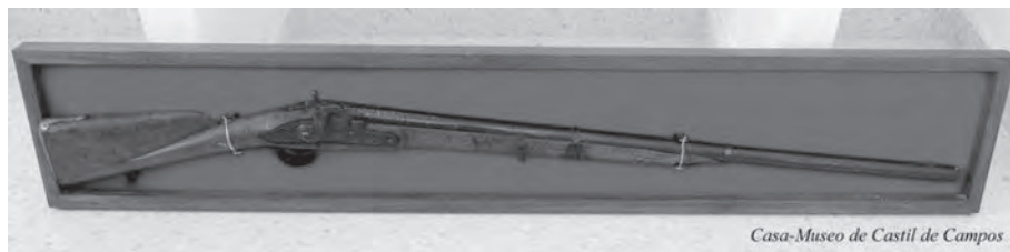
Casa-Museo de Castil de Campos