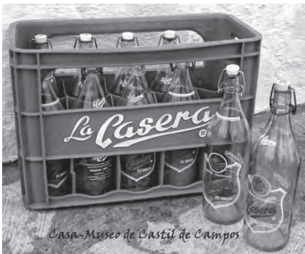
Caja de gaseosas La Casera donada en 2014