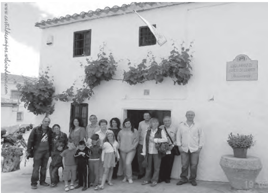
Visita guiada a la Casa-Museo de Castil de Campos, 19 de mayo de 2012