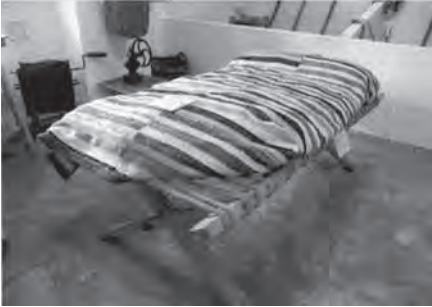
Detalle del tríptico de la Agenda Cultural de mayo 2012 del Excmo. Ayuntamiento de Priego, con la pieza del mes dedicada al catre de la Casa-Museo de Castil de Campos

El catre que aparece en la imagen se encuentra en la Casa-Museo de artes y costumbres populares de la aldea prieguense de Castil de Campos, que cumple el 19 de mayo de 2012 su X ANIVERSARIO. Se trata de una cama para una sola persona, con lecho de cuerdas entrelazadas hechas de esparto, y armazón compuesto por dos largueros, y cuatro pies cruzados en aspa y sujetos por una clavija para poder plegarlo. Lo cubre un vistoso gobierno, manta tejida en un antiguo telar del pueblo y realizado con tiras de variados y vivos colores, hechas con retazos de tela retorcidos y entretejidos con hilo fuerte.