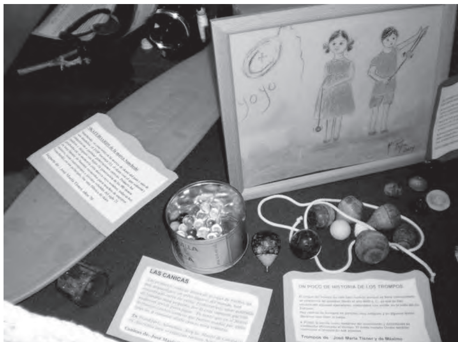
Canicas, trompos y yoyos, de la exposición temporal del IES Álvarez Cubero.