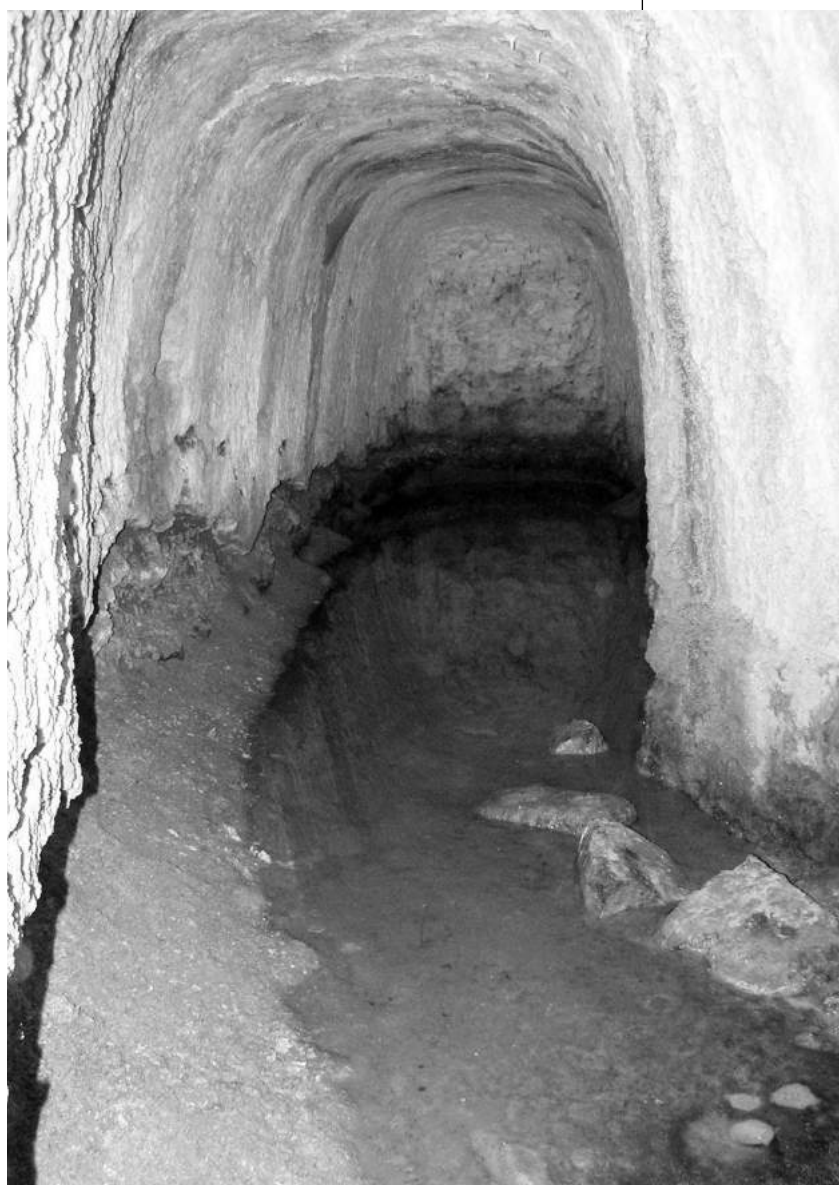
Figura 7. Galería de la Mina Grande. Salinas Espartinas.

de una salina de insolación plantea dos problemas: uno, su densidad salina es baja, sobre todo la del agua del mar, insuficiente para que precipite el cloruro sódico; otro, contiene impurezas y otras sales que si precipitasen junto con la sal dañarían su calidad e incluso la harían incomedible. Por estas razones, la fabricación de sal por el método de insolación precisa de dos etapas básicas. La primera consiste en elevar la densidad hasta los 25° Bé, graduación a partir de la cual cristaliza el cloruro sódico. Para ello, el agua salada se acumula en estanques grandes -presones, concentradores o calentadores-, donde al tiempo que eleva su temperatura, se evapora aumentando su densidad salina, y deposita las impurezas y sales como el carbonato cálcico. Estos concentradores sirven también como depósitos de reserva de agua para el verano. La segunda etapa estriba en la precipitación