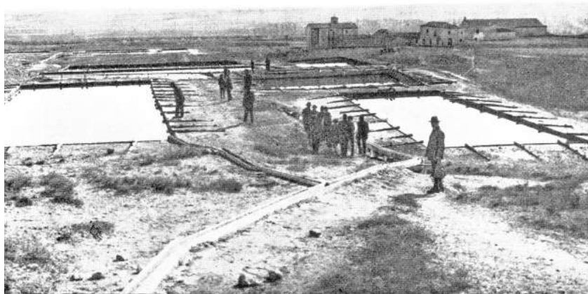
Figura 2. Salinas de Espartinas (Ciempozuelos, Madrid). Balsas y edificios. 1926, con motivo de la celebración del XIV Congreso Geológico Internacional.