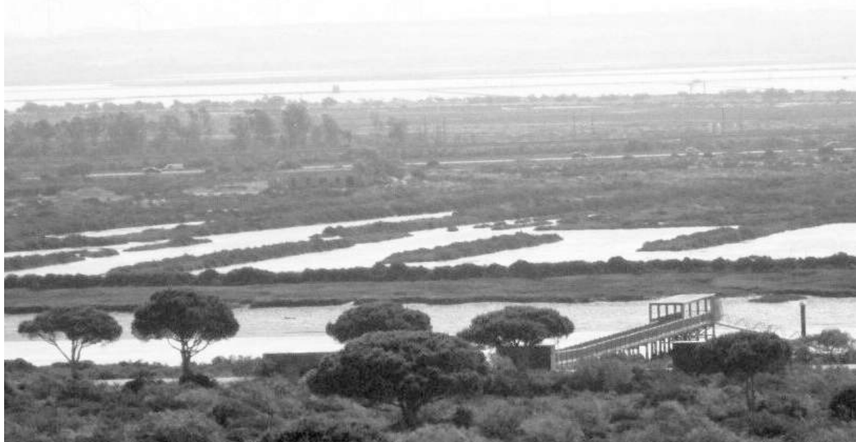
Figura 4. Las Salinas del Puerto de Santa María.

El último conjunto del Atlántico reúne las salinas costeras de Galicia y Asturias de cuya existencia se tienen noticias desde época temprana: documentos de los siglos IX-XI citan officinae salinarum en Pravia, en las marismas del Eo y del Sella en Asturias; del siglo IX datan referencias escritas a salinas en la Lanzada, territorium saliniense , que dio lugar al topónimo Salnés . Sin embargo, estas referencias desaparecen a partir del siglo XII seguramente porque estas fábricas de sal, con una producción escasa, inestable y mala, debieron de cerrar cuando el desarrollo de la vida urbana y del comercio permitió el abastecimiento de este mineral, más barato y de mejor