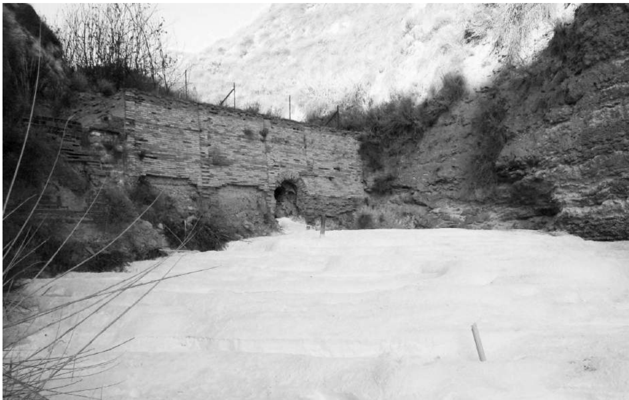
Figura 1. Salinas de Carcavallana (Villamanrique de Tajo, Madrid). Manantial salado y mina.

Con todo, esta relación mercantil entre consumidores y productores de la sal, organizada ya en los dos últimos siglos de la Edad Media, quedó gravemente limitada por el establecimiento de monopolios, gabelas o estancos