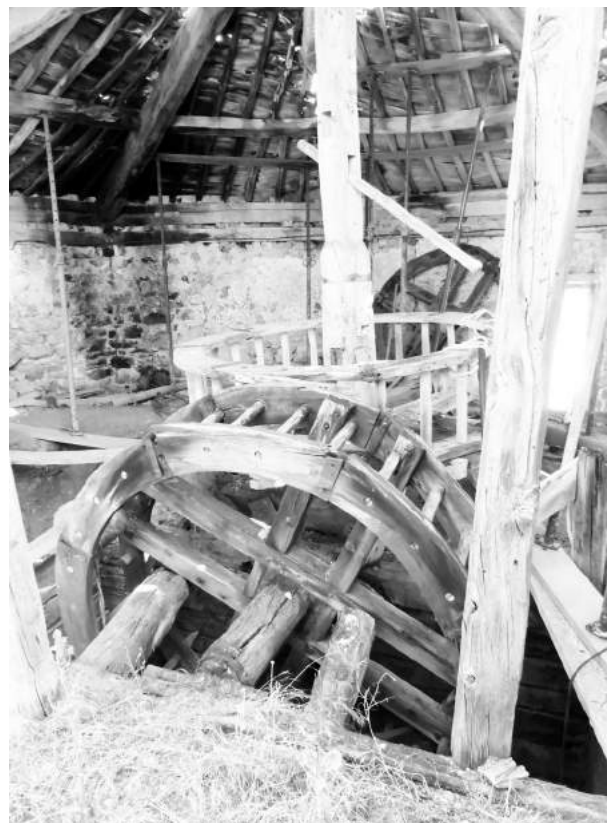
Figura 8. Noria de tradición mudéjar. Salinas de Imón.

A su vez, el modelo de las salinas mediterráneas surge de la colonización extensiva de lagunas costeras y albuferas que utilizan la capacidad impermeable del barro aluvial (Luengo y Marín, 1994: 196 y ss.). Son restos de antiguos golfos y bahías que las corrientes marinas y los vientos fueron separando del mar mediante la formación de cordones litorales o restingas. Además, las aguas de este mar son más cálidas y tienen una mayor densidad