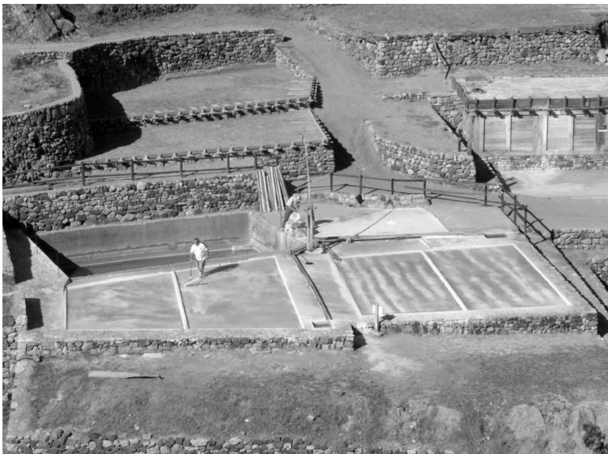
Figura 6. Salinas de Poza de la Sal. Eras sobre terrazas.

La técnica agrícola se llama así por las similitudes que guarda con el trabajo de los campos, especialmente los irrigados. Estas semejanzas aparecen en textos franceses