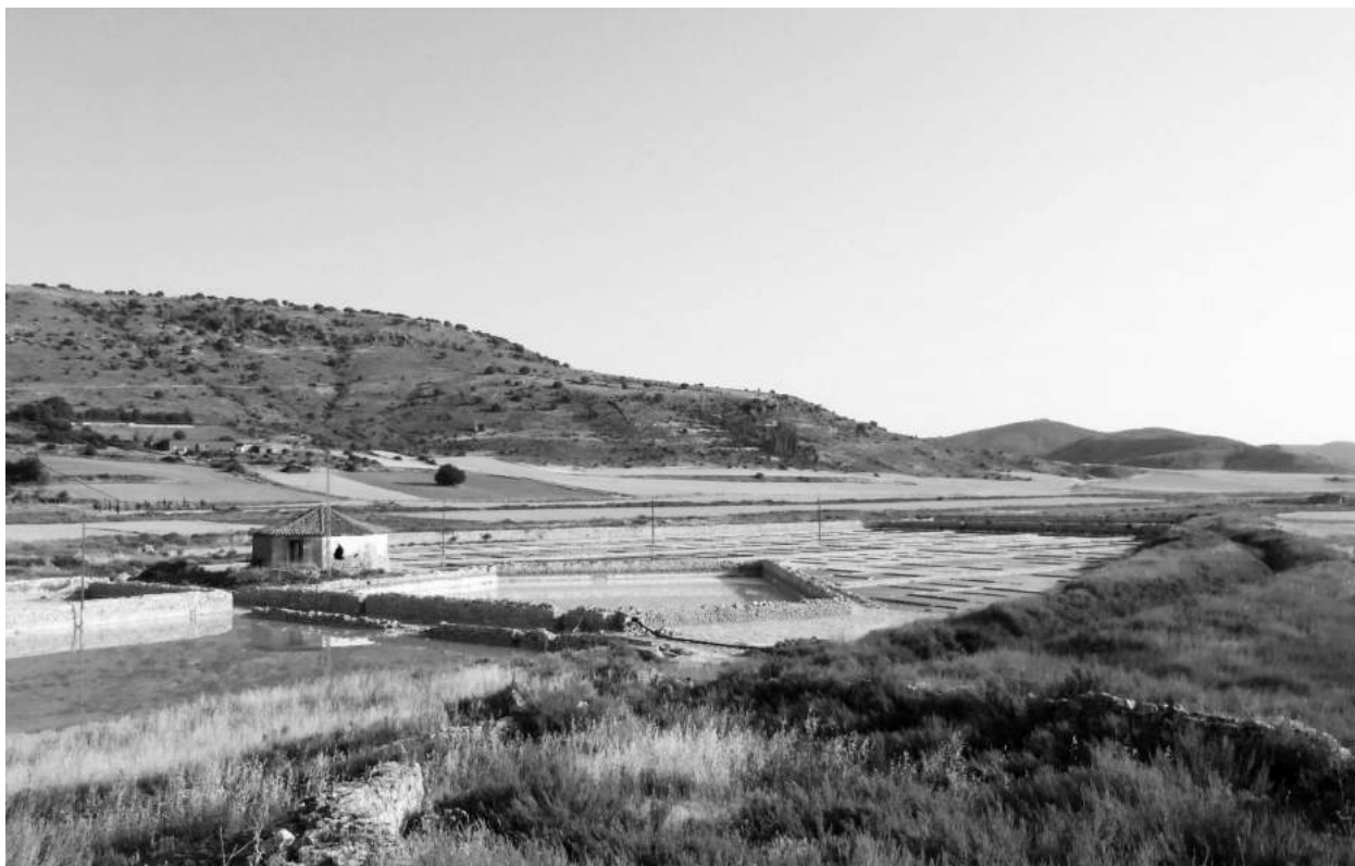
Figura 5. Salinas de Imón, cerca de Sigüenza (Guadalajara). Concentrador y eras en torno al cobertizo del pozo.

El tercer grupo, el más numeroso, lo constituyen las salinas que toman el agua salobre de fuentes, arroyos o pozos y que encontramos casi siempre cercanas a las