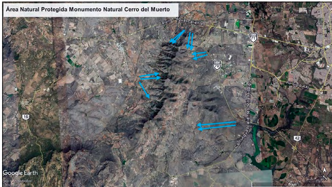
Figura 3. Transectos realizados en el Área Natural Protegida Monumento Natural Cerro del Muerto. La dirección de la flecha indica su orientación. Imagen satelital tomada de Google Earth (2016).

Las recolecciones se efectuaron a medida que se hacía el recorrido siguiendo la dirección del transecto planeado. Se siguió el método propuesto por Sánchez-González & González Ledesma (2007), que sugiere seleccionar ejemplares saludables y procurar que cuenten con material reproductivo (flor y/o fruto). También se recopilaban ejemplares sin estructuras reproductivas, ya que algunas especies pueden identificarse utilizando caracteres vegetativos, como forma y color de tallo, tamaño y número de espinas, tamaño de la planta, entre otros.