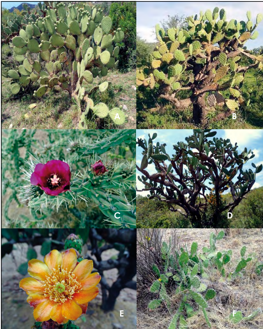
Figura 5. Cactáceas del Área Natural Protegida Monumento Natural Cerro del Muerto. A) O. durangensis , B) O. hyptiacantha , C) O. imbricata , D) O. jaliscana , E) O. lasiacantha (flor), F) O. rastrera .