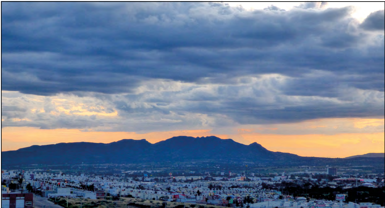
Figura 2. Vista panorámica del Área Natural Protegida Monumento Natural Cerro del Muerto.

Debido a la falta de documentación sobre la presencia de especies de Cactaceae en esta ANP, el presente estudio buscó corroborar la información ofrecida en los documentos oficiales (borrador y plan de manejo). La hipótesis de trabajo fue que se deberían de encontrar en el MNM las especies reportadas en los documentos mencionados. El estudio se efectuó a través de salidas a campo y de la obtención de ejemplares de herbario, los cuales representan una evidencia clara sobre la presencia de la familia Cactaceae en el MNM.