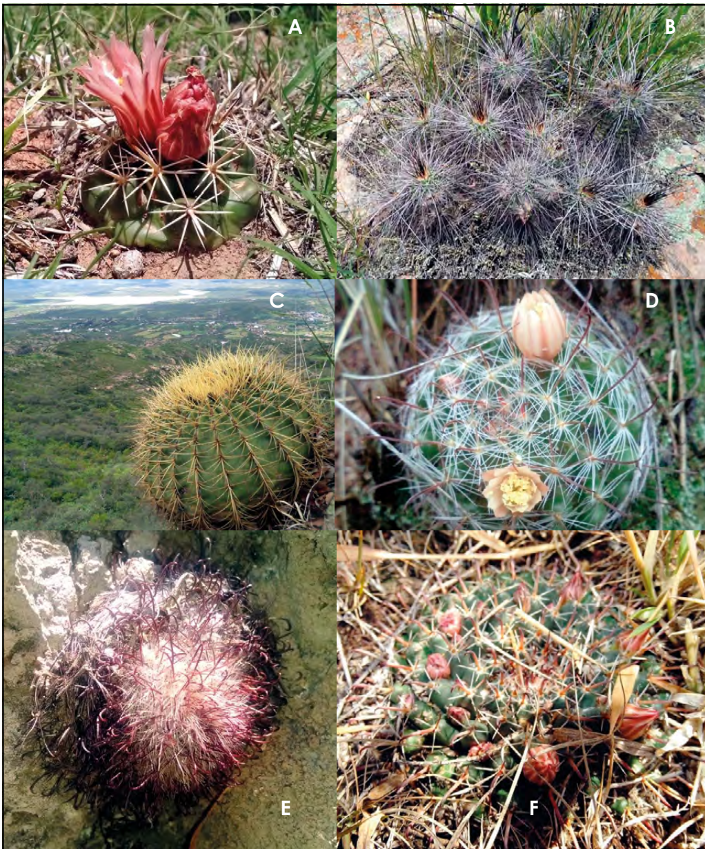
Figura 4. Cactáceas del Área Natural Protegida Monumento Natural Cerro del Muerto. A) C. ottonis , B) E. sp. , C) F. histrix , D) M. bombycina subsp. bombycina , E) M. bombycina subsp. perezdelarosae , F) M. uncinata .

Opuntia jaliscana Bravo Opuntia joconostle F.A.C. Weber ex Diguét Opuntia lasiacantha Pfeiff. Opuntia rastrera F.A.C. Weber Opuntia robusta J. C. Wendl. Opuntia streptacantha Lem. Opuntia tomentosa Salm-Dyck Stenocactus heteracanthus (Muehlenpf.) A. Berger ex A.W. Hill