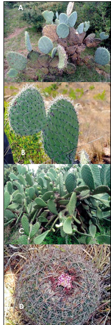
Figura 6. Cactáceas del Área Natural Protegida Monumento Natural Cerro del Muerto. A) O. robusta , B) O. streptacantha , C) O. tomentosa , D) S. heteracanthus .