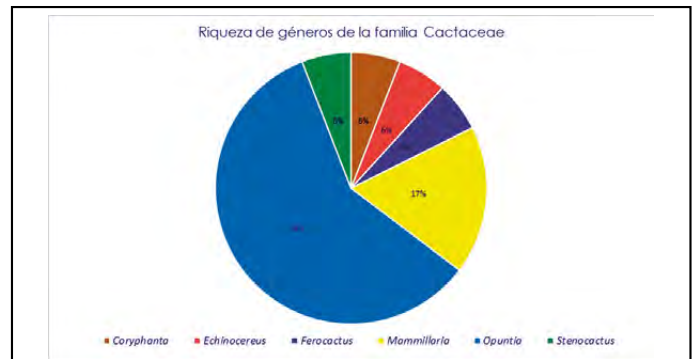
Figura 7. Porcentaje que representa la riqueza de cada uno de los géneros de la familia Cactaceae presentes en el Área Natural Protegida Monumento Natural Cerro del Muerto. Elaboración propia.

Los ejemplares de herbario que resultaron de este estudio fueron depositados en el herbario de la