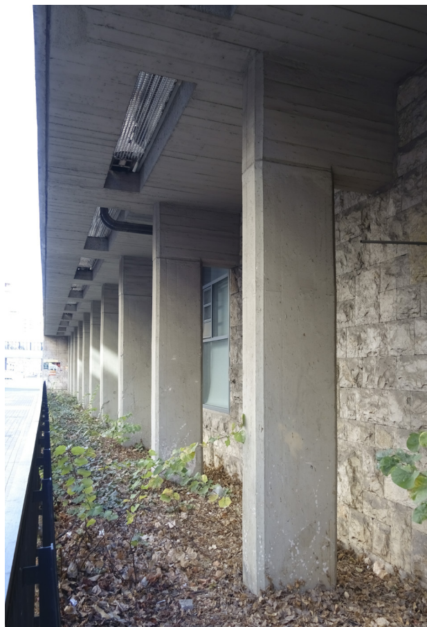
8. Pilares de hormigón y paramento de piedra en la fachada lateral de la Facultad de Geografía e Historia, en la calle Dr. Moliner

Estas fábricas han sido modificadas, tanto en el pasado como en época actual. En líneas generales, estas actuaciones han restado calidad al conjunto de los edificios universitarios de Moreno Barberá. La incorporación de nuevos elementos, o el derribo de algunas de sus partes, han desvirtuado su imagen inicial, más moderna y rupturista. Un ejemplo significativo de estos procesos fue la reforma y rehabilitación de la Escuela de Ingenieros Agrónomos, hoy Facultad de Psicología. En las imágenes de este edificio podemos ver el añadido de obra [10]: sobre el edificio longitudinal de una sola planta, en la fachada principal situada en la avenida de Blasco Ibáñez, se construye, totalmente nuevo, un segundo piso; añadiendo además en el exterior una sucesión de columnas lisas, muy del gusto moderno también 19 . Esta