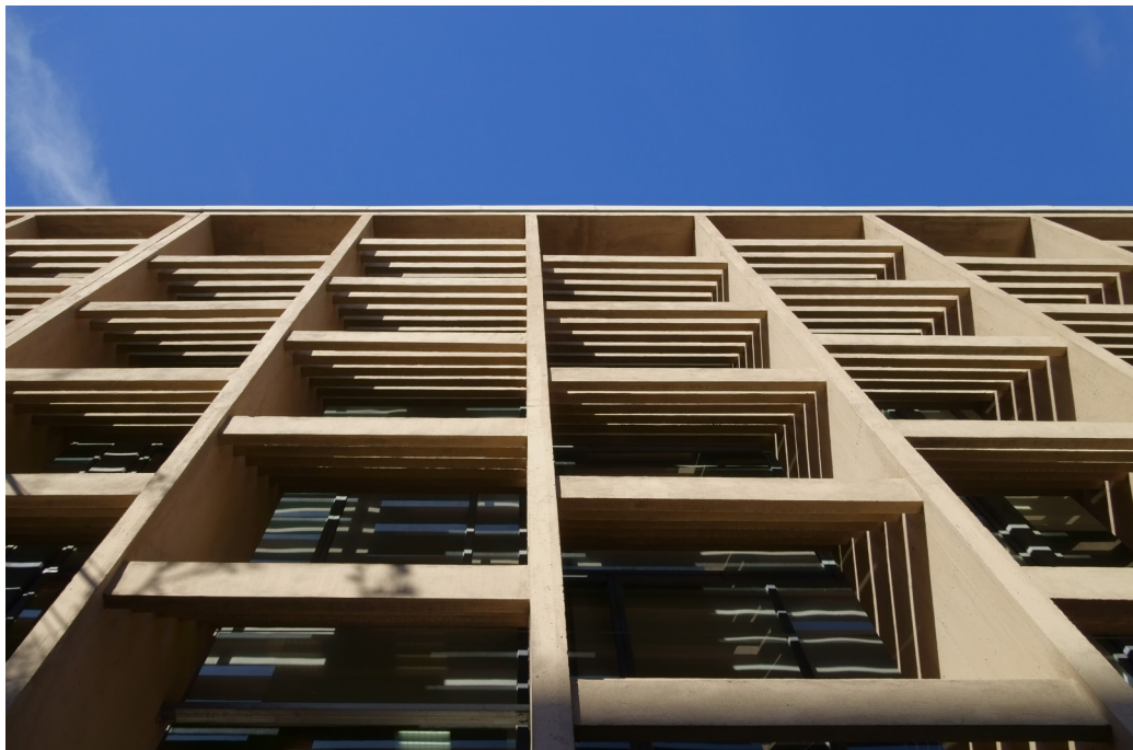
5. Parasoles horizontales fijos en la fachada lateral de la Facultad de Filosofía y Ciencias de la Educación, en la calle Dr. Rodríguez Fornos