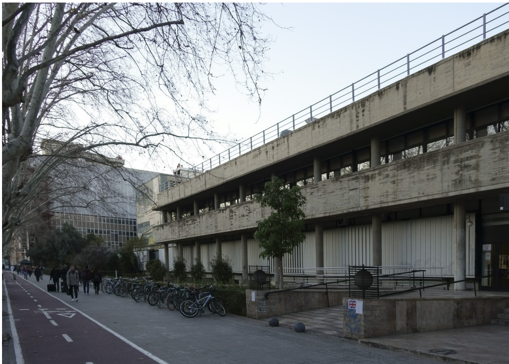
10. Fachada principal de la antigua Escuela de Ingenieros Agrónomos, hoy Facultad de Psicología, en la avenida Blasco Ibáñez, 21 (Fotografía del autor, 2018)