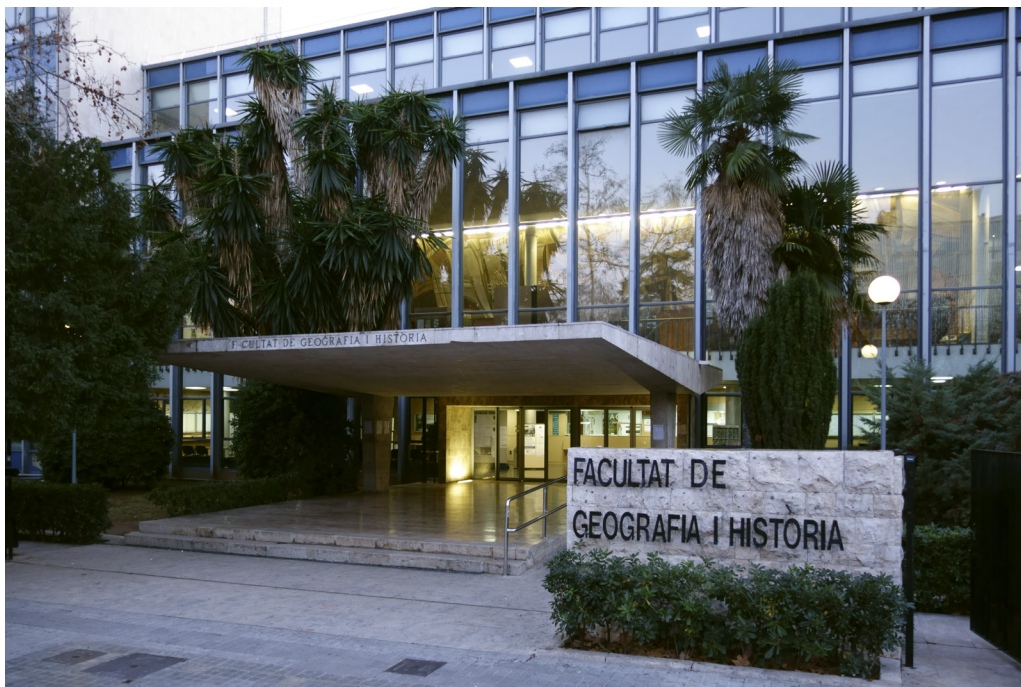
7. Marquesina de la entrada principal de la Facultad de Geografía e Historia

del Campo de Deportes de Goerlich, situado en la fachada del paseo de Valencia al Mar, se van a levantar estos nuevos edificios. Por lo tanto, era necesario para los intereses de la Universidad que un nuevo campo deportivo sustituyera al que iba a derribarse. La solución finalmente adoptada pasó por edificar uno nuevo a espaldas de estas Escuelas.