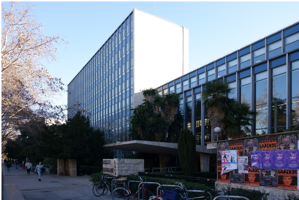
6. Edificio y entrada principal de la Facultad de Filosofía y Letras, hoy de Geografía e Historia, en la avenida Blasco Ibáñez, 28

menzó finalmente entre febrero y marzo de 1960 14 . Sobre su terminación, debemos acudir al acta del día 12 de septiembre de 1963, que señala: