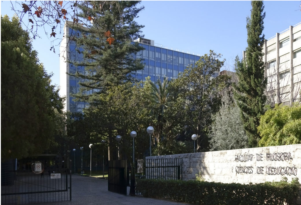
3. Edificio principal de la Facultad de Derecho, hoy Facultad de Filosofía y Ciencias de la Educación, en la avenida Blasco Ibáñez, 30 (Fotografía del autor, 2018)