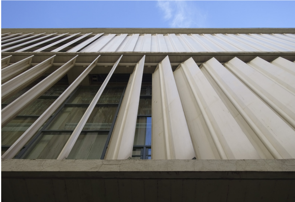
9. Parasoles verticales orientables en la fachada lateral de la Facultad de Geografía e Historia, en la calle Dr. Moliner