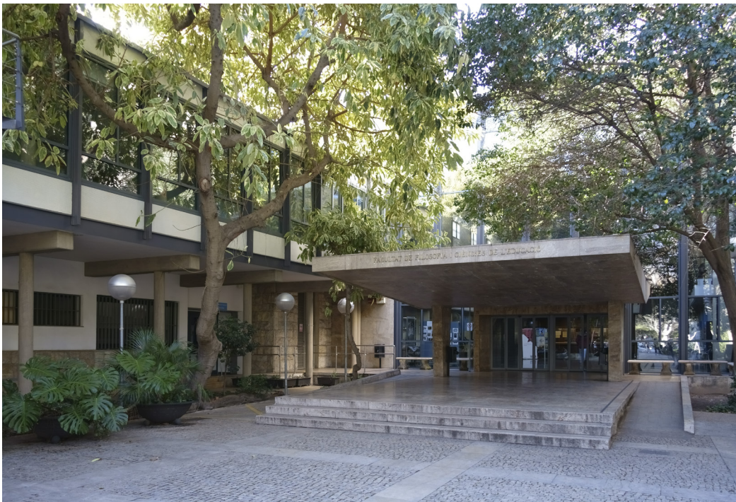
4. Marquesina y entrada principal de la Facultad de Filosofía y Ciencias de la Educación (Fotografía del autor, 2018)