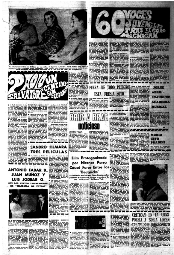
FIGURA 3. Reseña (anónima) en el periódico El Siglo , órgano del Partido Comunista Chileno

ción del propio Mestman, sino también por el modo en que traza una especie de mapa cognitivo de las operaciones conceptuales y estrategias críticas en el campo de los estudios de cine latinoamericano de aquel periodo. La introducción de Mestman resume los interrogantes que dieron pie a su selección de trabajos a partir de las tensiones o contradicciones entre distintos modos de comprender el concepto de “vanguardia”, ya sea en términos políticos, ligados a una izquierda militante, o en términos estéticos, ligados a diversas poéticas (frecuentemente divergentes) de la experimentación. Como en varios de sus trabajos anteriores –incluida entre ellas su colaboración con Ana Longoni ( Del Di Tella a “Tucumán arde” ) sobre la cultura visual argentina ( Tucumán arde y el Instituto Di Tella)– la estrategia de Mestman en este volumen colectivo sobre las “rupturas” del 68 supone cierto cuestionamiento de un consabido esquema que contrapone “militancia” y “experimentación estética”.