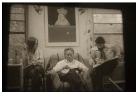
FIGURAS 4 Y 5. Fotos de Homenaje a Nicanor Parra

El plano medio de la lectura y de la conversación entrecortada por momentos simula o parodia un encuadre convencional televisivo del género-entrevista, lo que indica la acción mediática del filme. Para tener una mejor idea de la deriva mediática del encuadre, vale la pena notar que hacia esos mismos años surgen los primeros “ talk shows ” en la TV, género que evidencia una temprana curiosidad comercial ante la excentricidad pintoresca de