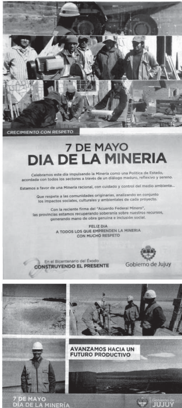
Figura 2. Imágenes de los trabajadores mineros. Avisos gubernamentales emitidos en los años 2012 y 2015 en diario Pregón .