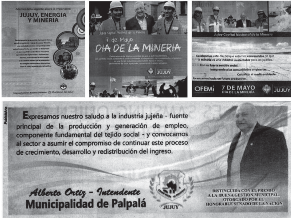
Figura 5. Protagonismo de los mandatarios en ejercicio. Avisos gubernamentales emitidos por el Día de la Minería (años 2010, 2013 y 2014) y por el Día de la Industria (año 2012) en diario Pregón .

Pese a esta difícil situación coyuntural, en los avisos gubernamentales que se emitieron durante estos años se observa una clara intencionalidad en destacar a Jujuy como una provincia que, en parte debido a su riqueza de materia prima, es un actor relevante dentro del conjunto nacional. Esto se evidencia en el aviso de 1984, en el cual se parte de la fórmula nominalizada (Verón, 1987): “Minería, de Jujuy para el país” para destacar el potencial económico de la provincia en este rubro. Se continúa explicando: “La labor extractiva reafirma la presencia de Jujuy en el concierto económico nacional”.