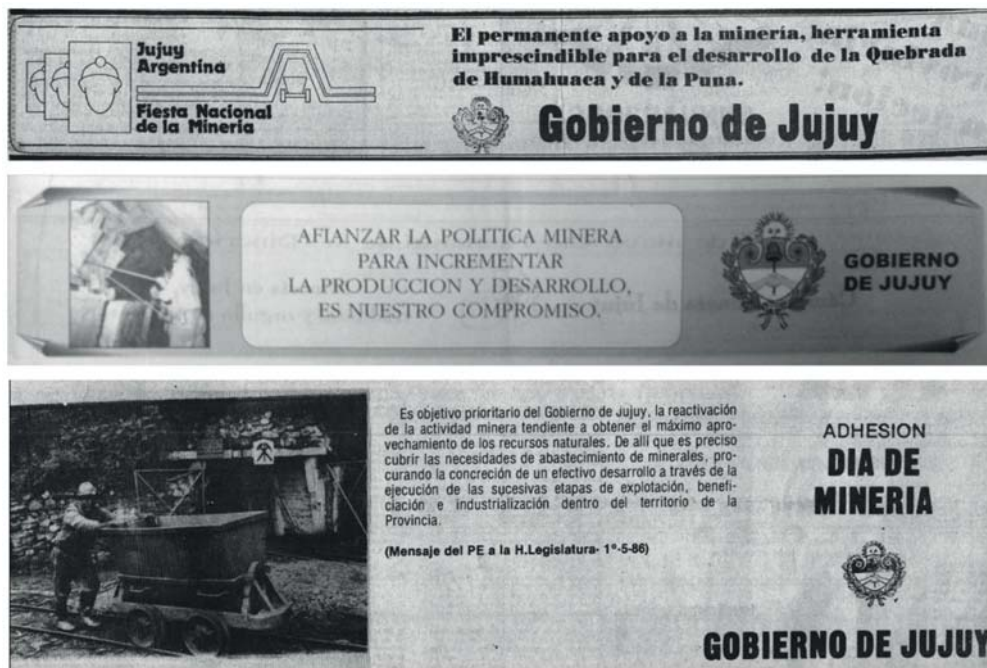
Figura 1. Imágenes de los trabajadores mineros. Avisos gubernamentales emitidos en los años 1987, 1986 y 2004 en diario Pregón .

En relación con el género y la/s pose/s, se debe destacar que siempre se retratan varones y son registrados de dos maneras posibles; por un lado, se encuentran realizando sus actividades diarias, y por el otro, posando para la fotografía que está tomada en eventos específicos. Esto resulta significativo en tanto no es habitual que los trabajadores estén mirando el objetivo de la cámara, según lo observado en otras imágenes, en las que se retrata a trabajadores varones y mujeres de diferentes sectores de la economía jujeña, puesto que son regularmente retratados en plena ejecución de sus tareas laborales, sin establecer contacto directo con el obturador (Scalone, 2015).