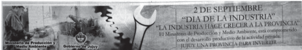
Figura 3. Imágenes de los trabajadores industriales. Aviso gubernamental emitido en 2007 en diario Pregón .

Para el caso del Día de la Industria solamente se observa una fotografía en la que se retrata a un trabajador del rubro (fig. 3). Sin embargo, ésta mantiene las mismas características que las relativas al trabajador minero. La persona es retratada de perfil, en plena ejecución de sus actividades y vestida con indumentaria de trabajo.