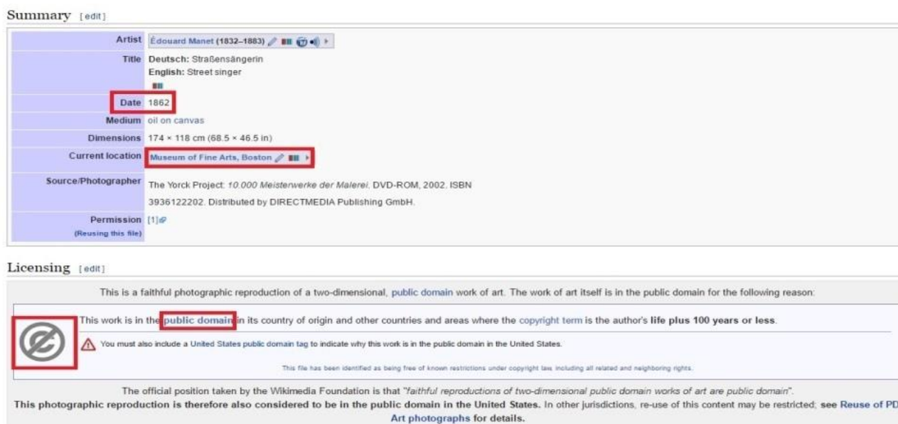
Figura 1. Identificação de domínio público de uma fotografia