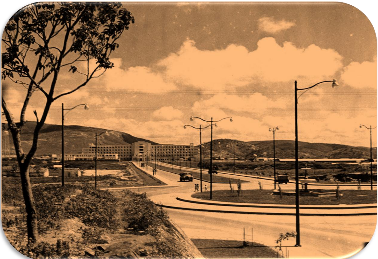
Imagen 4. Recién inaugurado Hospital Antonio María Pineda, al Norte de la Avenida Vargas, año 1954. Barquisimeto, estado Lara, Venezuela.