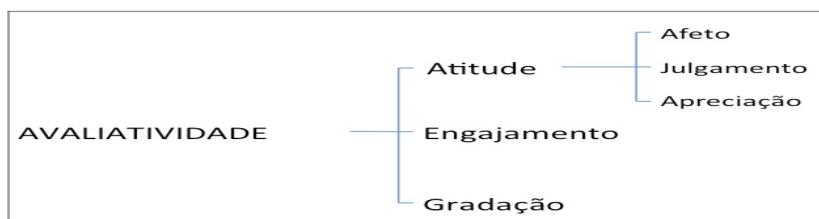
FIGURA 1 - SISTEMA DE AVALIATIVIDADE