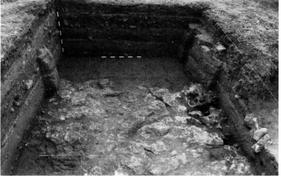
Foto 1.-Cata A. Vista General.