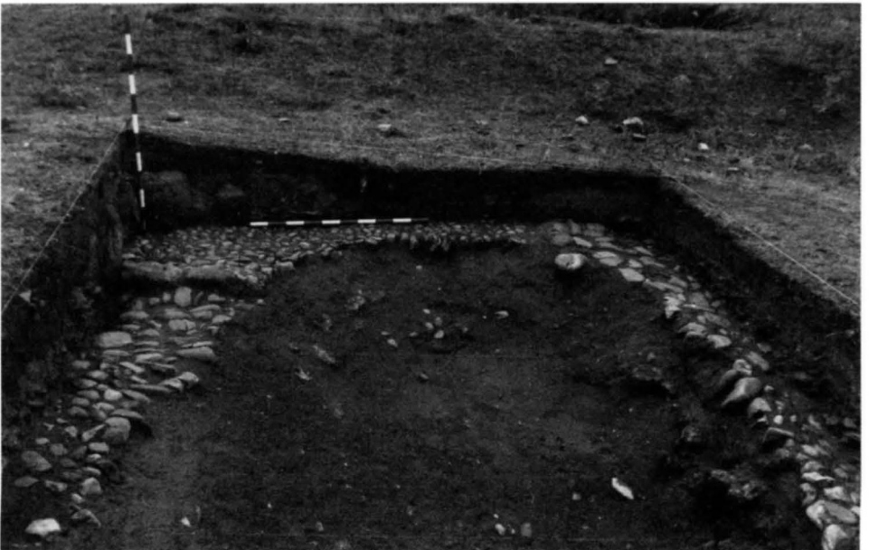
Foto 2.-Cata B. Encanchado.