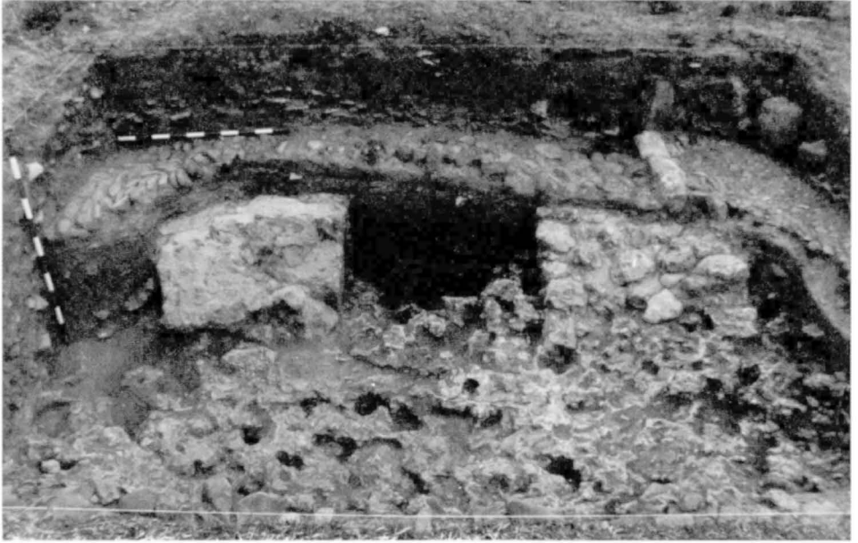
Foto 3.-Cata B. Encancho y restos de dos muros.