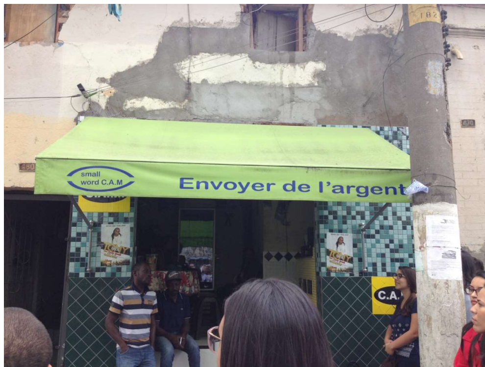
Figura 6: Casa de cambio en la Región de Glicério