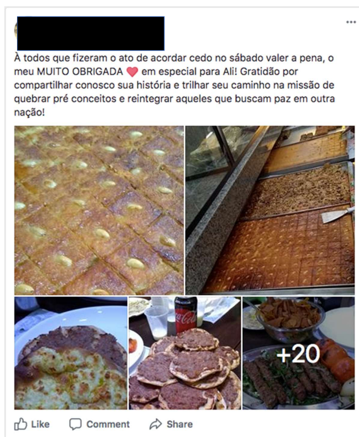
Figura 3: Reacciones de los participantes del 3o Walking Tour SP para Todos