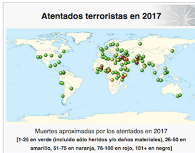
Figura 1: Atentados terroristas en 2017

Estos resultados sitúan los primeros 6 meses del año 2017 como los de mayor crecimiento en los últimos 7 años. Paralela y paradójicamente en 2017 se reportaron ataques terroristas en diversas partes del mundo, incluyendo ataques por motivos políticos de actores violentos no estatales (Figura 1).