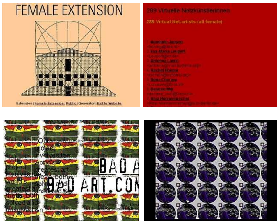
Figuras 1, 2, 3 y 4. Cornelia Sollfrank. Female Extension . 1997. Imágenes de la obra.

Una vez más, el museo expresó en un comunicado de prensa su gran satisfacción por el elevado número de participantes: "En la fecha de cierre el 30 de junio, 120 megabyte de arte en la red. 96 de los artistas que se han presentado eran de Alemania, 81 de los Países Bajos, 28 de los EE.UU., 27 de Eslovenia y 26 de Austria" 9 .