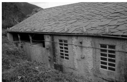
O Agro, Merille