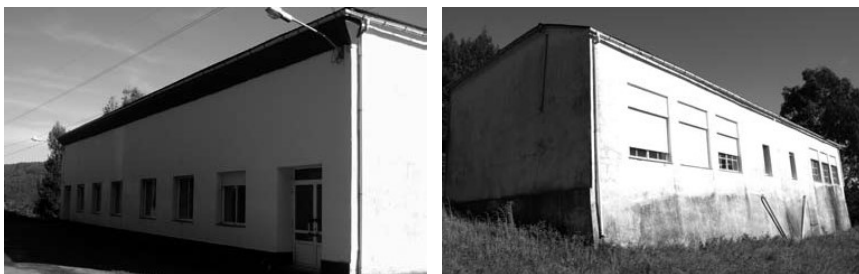
Souto Chao, Xerdiz

unha nova tramitación. 54 Finalmente, aínda que o edificio está pensado para albergar dúas escolas unitarias, instálase nel unha escola mixta servida por mestre. 55