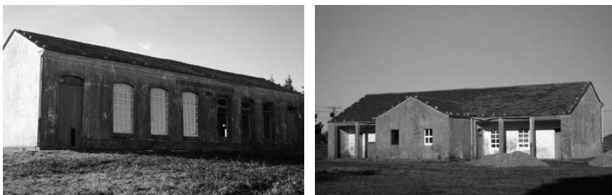
O Vilar, Riobarba