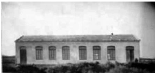
Grupo Escolar Vivero y su Comarca, fotografía exposta hoxe en día na sede social da Habana

Aínda que esta sociedade estaba integrada polos emigrantes naturais de Viveiro, Riobarba 4 , Oourol, Muras, Xove e Cervo, esta investigación encádrase tan só nos tres primeiros municipios citados, por ser estes os únicos nos que se atopa a tipoloxía obxecto de análise.