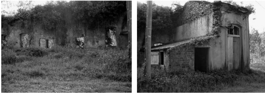
A Viga, Bravos

verán consolidados os seus respectivos planteis educativos mediante o procedemento de emisión de bonos e subscripción de donativos.