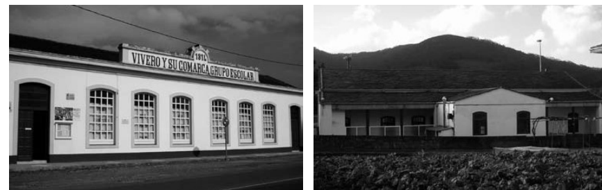
A Ruanova, Magazos.

Os trámites de construción de ambos os dous edificios iníciase paralelamente, aínda que as circunstancias farán que a inauguración da escola de Valcarría, se atrase bastante respecto á de Magazos. Os soares sobre os que se asentaban estas edificacións estiveron no seu