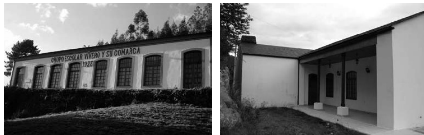
A Corredoira, Valcarría

O grupo escolar de A Corredoira (Valcarría), inicia a súa andaina unha vez realizado o primeiro sorteo da sociedade no que esta parroquia sac agraciada. Na xunta directiva nº 9, do 30 de Setembro de 1911, determínase a súa situación en Cristo da Corredoira . 69 En 1916 a obra paráízase por falta de recursos 70 , despois de investirse ata a data 8.771 pesetas e faltando para rematala, segundo o mestre de obras, 12.093 pesetas; ao