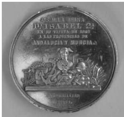
Fig. n.º 1.- Medalla conmemorativa de la visita de Isabel II a Andalucía. Todas las imágenes de este artículo han sido facilitadas por el autor del mismo.