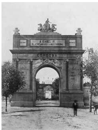
Fig. n.º 7.- Arco de triunfo de Puerta Nueva.

cia en Córdoba. En Palacio permanecieron la familia real y ciento quince servidores; el resto de la comitiva se alojó en casas particulares. Mientras, vistosas luminarias alumbraron la ciudad aquella noche del 14 de septiembre, luminarias que se mantuvieron durante toda la estancia de los soberanos en ella.