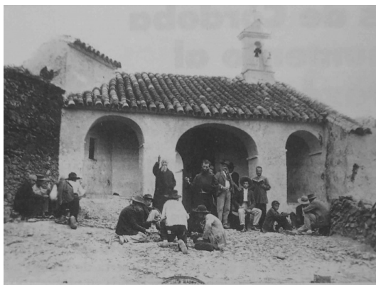
Fig. n.º 9.- Las Ermitas de Córdoba.

Isabel y Francisco de Asís se despidieron amablemente de sus anfitriones y en compañía de los ministros y del presidente